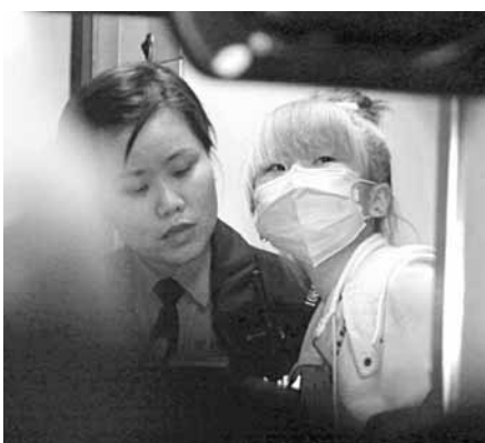
企圖由5樓外牆沿水渠落樓而意外墮樓受傷少女，送院時清醒。

香港文匯報訊(記者 杜法祖)一名16歲少女，前晚元宵佳節被家人下「禁足令」，不准離開西區寓所。少女心有不甘，至昨凌晨，竟冒險攀上5樓窗口，圖沿水渠游牆落街。詎料，少女中途失足，直墮2樓窗簾發出巨響。母親聽見愛女墮樓，慌忙報警。消防員到場，證實事主僅雙腳擦傷及臀部疼痛。