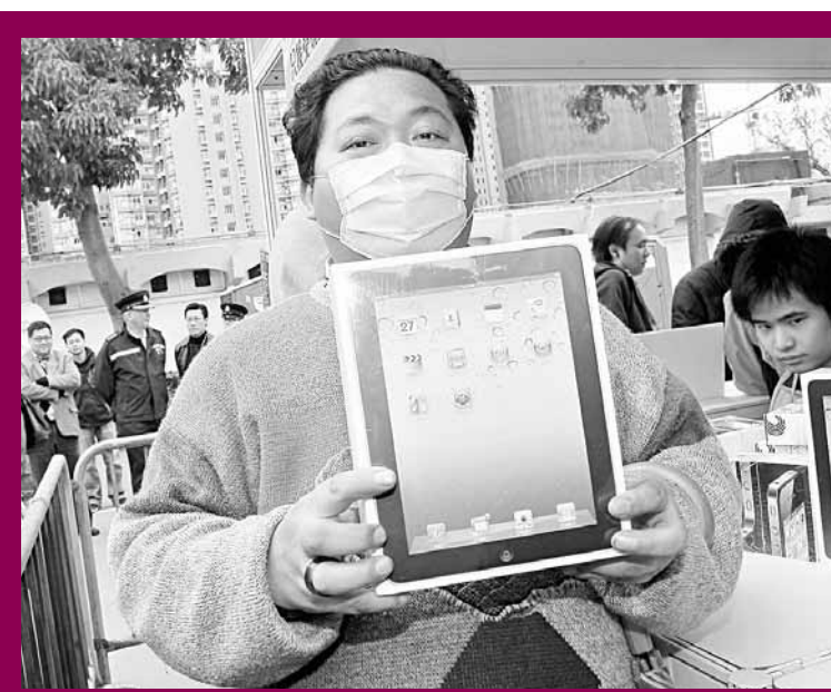
鍾先生表示，原本計劃為兒子購買電腦，從網上討論區得悉首日有一折iPad發售，立即與同事調更通宵排隊，終購得心頭好。

然而，亦有「香港電腦節」參展商藉着電腦節首度推出類似iPad的TOPCONpad，售價3,299元，並接受即場預訂，預計下月有貨。負責人指出，該部7吋平板電腦設有電話功能，流暢度亦可媲美iPad。該商戶同時參與「腦場電腦節」，負責人認為，電腦節同時舉行能增加銷售點，而腦場內其他產品的銷情較平日增加30%至50%。 「香港電腦節」主辦單位香港電腦商會主席梁定球強調，商會及協會同時舉辦電腦節，只會帶來良性競爭，對市民是好事，而參展商亦不會做蝕本生意。打「對台」的香港電腦業協會表示，腦場內產品售價不會高於香港電腦節，他們更會每日向排隊人士派發贈品，今天主打為2部分別價值逾2,000元的電子書。