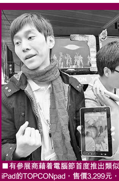
有參展商藉着電腦節首度推出類似iPad的TOPCONpad，售價3,299元，並接受即場預訂，預計下月有貨。