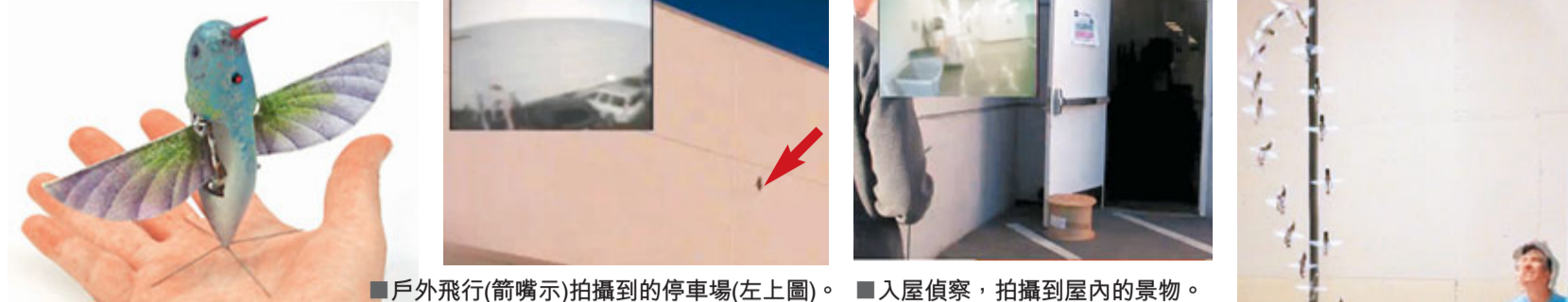
■戶外飛行(箭嘴)拍攝到的停車場(左上圖)。 ■入屋偵察,拍攝到屋內的景物。

影片： http://www.youtube.com/watch?v=96WbPggc37I