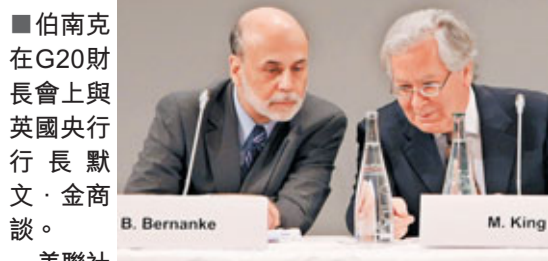
■伯南克在G20財長會上與英國央行行長默文·金商談。

20國集團(G20)財長昨日在法國巴黎,一連兩日開會商討對抗全球經濟失衡,防止未來再爆發金融危機。報道稱,在設立量度失衡的指標上,中國等主要經濟體意見明顯分歧。美國聯儲局主席伯南克警告,熱錢橫行已成新興經濟體的嚴峻挑戰,呼籲G20國家「釐清及加強規則」,避免全球經濟穩定受損。