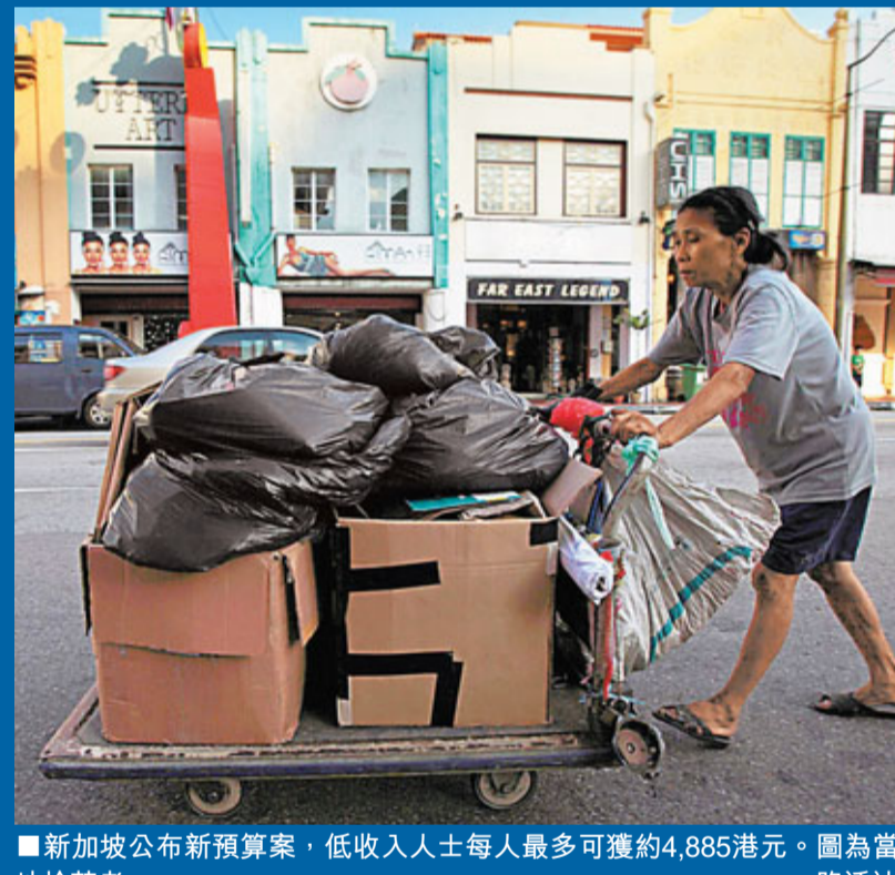
■新加坡公布新預算案,低收入人士每人最多可獲約4,885港元。圖為當地拾荒者。

在66億坡元的國民福利計劃中,中低層收入家庭將共獲發援助32億坡元(約195億港元),另外34億坡元(約208億港元)將投放在較長期的社會投資。