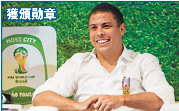
■昨日在巴西足球博物館一個儀式上，剛宣布退役的巴西球星拿度獲頒授體育勳章，以表揚他在足球事業上的貢獻。美聯社

在昨日倫敦高院的審訊中，英超利物浦紅軍的前美國班主希克斯不獲准在美國與訟尋求賠償，一切法律行動都需在英國進行。無力向蘇皇銀行還債的希氏認為，紅軍董事會與蘇皇銀行去年10月將球會以3億英鎊賣給新英倫體育集團，是不合法以及違反了自己的意願，聲稱這交易令他損失1.4億英鎊，故入稟法庭要求追討有關損失。希氏曾先後入稟英國與美國法庭要求阻止該交易。