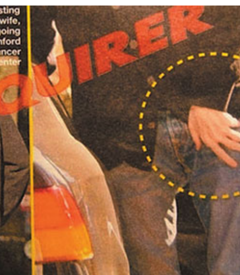
最新照片顯示,喬布斯頭髮稀疏,身體虛弱(左圖),手部與臀部見不到肌肉。

加布米爾金醫生說:「他到了晚期。你能看見由於熱量消耗引起的肌肉萎縮,這是由於癌症引起的。他的臀部已經看不見任何肌肉,而這是癌症最後侵蝕的地方。」他又表示,「如果他的體重還能超過130磅,我會感到