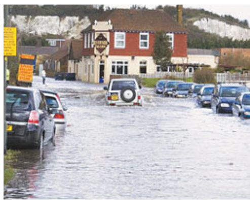
去年8月英國一個小鎮暴雨成災。災則造成逾17億美元(約132億港元)經濟損失。

該雜誌刊登的另一項報告則更深入具體,將氣候變化與英國2000年特大洪水聯繫起來。據參與研究的人員表示,從引發的洪災證明,極端天氣實際上為人類帶來傷害,2000年英國洪