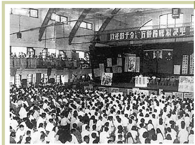
反右風暴波及當時中國約一半的知識分子。圖為反右運動動員大會。