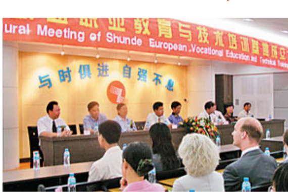
■德國歐盟職業教育與技術培訓基地成立大會