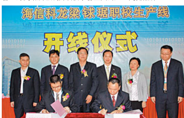
■「承包企業的生產線」是我校基地與海信科龍校企合作的新舉措

三是面向全國開展職教師資培訓，學校依托順德的產業環境優勢、學校實訓基地設備優勢、高素質的師資優勢、針對性強的培訓課程優勢和多年積累的師資培訓經驗優勢，使受訓教師的綜合素質和專業實踐能力得到顯著提高，得到了教育部、參培教師和送培學校的高度認可和讚譽。師資培訓已成為該校享譽全國的又一閃亮品牌。