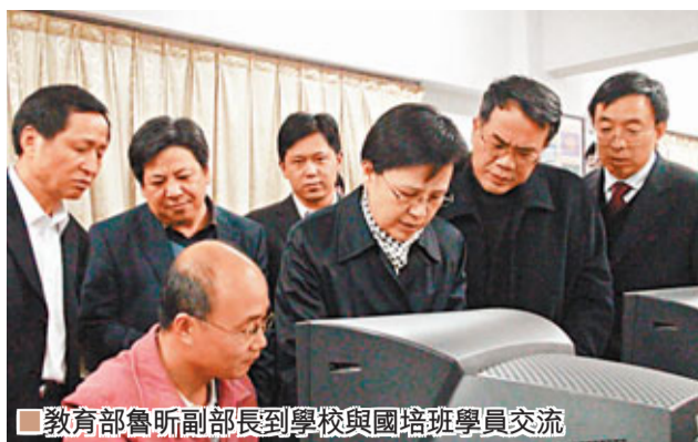
教育部魯昕副部長到學校與國培班學員交流