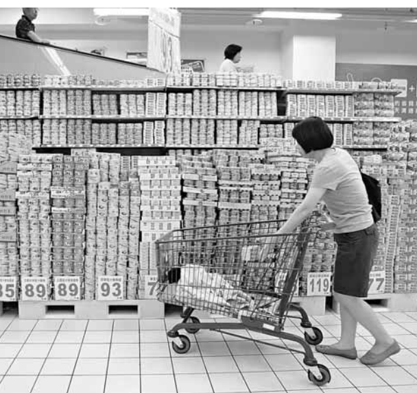
台灣春節後百物騰貴，令當地百姓叫苦連天。

與此同時，針對糖、小麥麵粉、雞肉等多項民生物資，有關方面已着手調查上游廠商到下游通路端，徹查業者是否有聯合漲價的壟斷情形。台南地檢署則調查大盤糖商是否囤積。