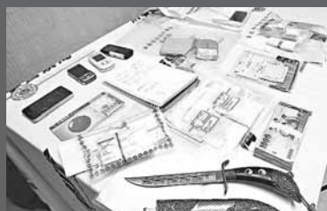
警方起出刀械、帳款單等證物。