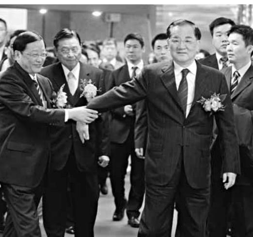
國民黨榮譽主席連戰(前右)、海基會董事長江丙坤(2排左)與遼寧省長陳政高(前左)合影。中央社

據中央社16日電 遼寧省長陳政高16日展開「關東風情寶島行」，他表示將出資新台幣2,000萬元，與新竹縣政府共同在五峰鄉興建張學良紀念園，此行並將採購總值1900萬元人民幣的台灣水果、茶葉農產品和台南魚丸。