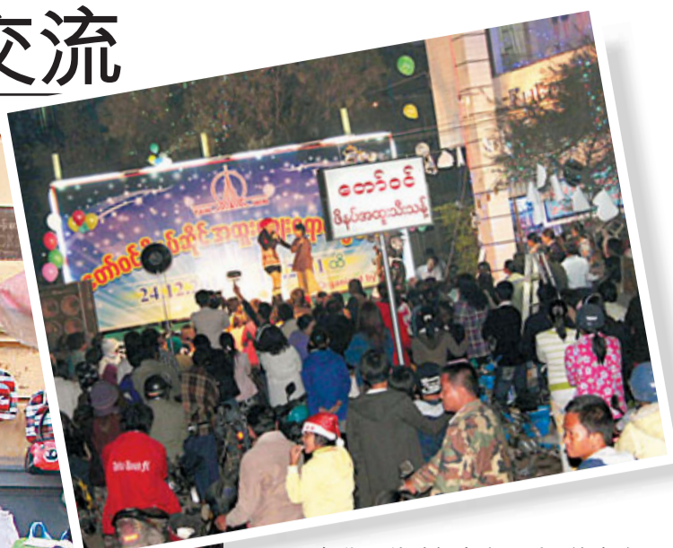
緬甸街頭的歌舞表演吸引了許多路人。