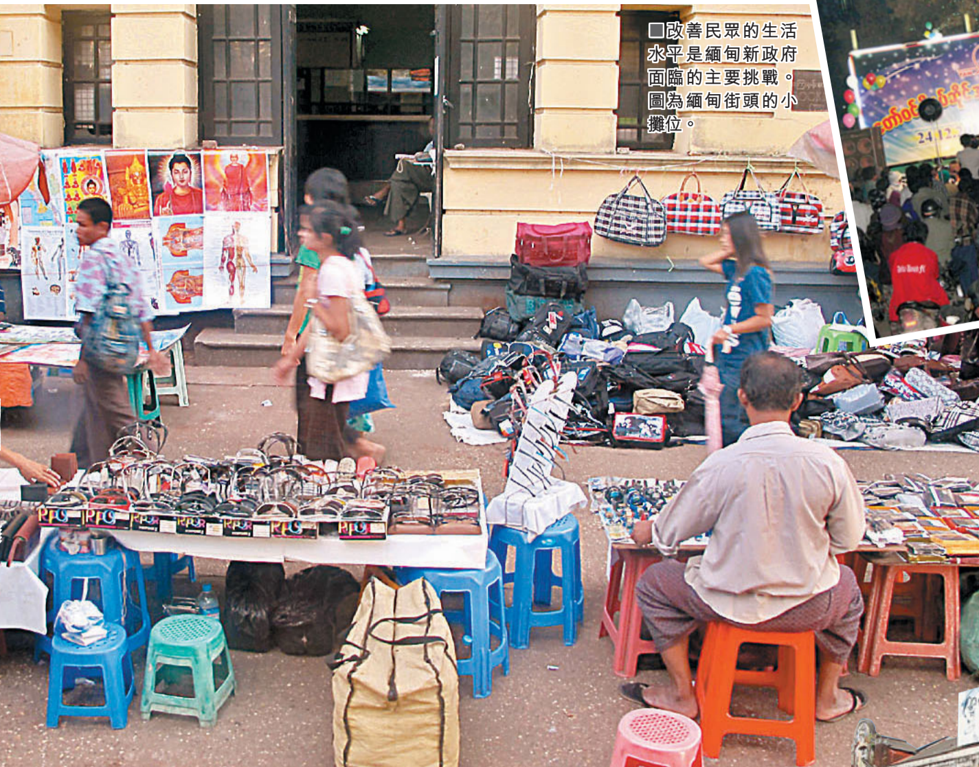
改善民眾的生活水平是緬甸新政府面臨的主要挑戰。圖為緬甸街頭的小攤位。