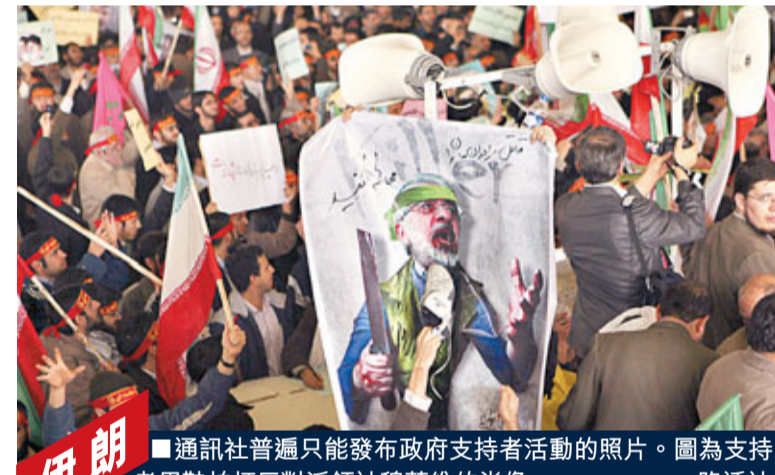
通訊社普遍只能發布政府支持者活動的照片。圖為支持者用鞋拍反對派領袖穆薩維的肖像。

中東示威浪潮席捲美國的死敵伊朗和中東盟友巴林，奧巴馬政府展現出兩種截然不同的態度：一方面鼓吹伊朗民眾追求自由；另一方面促請巴林國王回應人民訴求。專家指，這反映了美國推行民主自由理念，完全建基於其中東利益布局的戰略考量。 奧巴馬日前批評伊朗領導人「鼓勵埃及示威在前，打壓國內示威在後，做法虛偽」，鼓勵伊朗人「鼓起勇氣表達追求更大自由和更有代表性政府」，毫不掩飾地企圖利用伊朗社會裂痕，達到推翻現政權的目的。 巴林暴力衝突其實不遑多讓，迄今至少有兩名示威者喪生，政府封鎖視頻阻止上載圖片。但奧巴馬隻字不提暴力事件，巧妙地對巴林政府而非示威者喊話，呼籲盟友尊重年輕一代追求變革。為了自圓其說，他區分埃及起義和伊朗2009年示威，批評後者槍殺和拘捕示威者，封鎖互聯網和手機網絡。 穆巴拉克倒台，華府頓失中東一大支柱，伊朗視之為美國和以色列在中東的勢力減弱；但與此同時，伊朗多個城市亦爆發反政府示威，美國乘勢反擊，與伊朗展開地區主導權爭奪戰。 前國務院伊朗政策顧問馬洛尼指出，奧巴馬對伊朗核談判的前景悲觀，因此美伊的對抗將會趨尖銳。過去數年，什葉派非阿拉伯國家伊朗在伊拉克、黎巴嫩和巴勒斯坦的勢力漸長，隨著什葉派佔多数的也門和巴林示威擴大，伊朗的勢力可望進一步提升。 不過，美國亦有一線曙光。今年之前，中東認為「英雄」就是敢於與華府對抗。但突、埃變天，讓阿拉伯人明白到「英雄」變成敢於抗衡高壓管治的個體，這令伊朗處於不利位置。 華府對伊朗，巴林的反政府示威抗議奉行「雙重標準」頗耐人尋味。 奧巴馬的講話展露「鍾無艷」嘴臉，無非是為巴林是輔助美國孤立伊朗的中東盟友，而伊朗內賣德政府則是美國急欲推翻的「邪惡政權」。 【翟草】