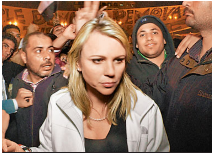
洛根2月11日晚被侵犯前不久拍下的照片。

埃及示威騷亂期間，外國傳媒紛紛投訴遭暴民對待。美國哥倫比亞廣播公司(CBS)表示，埃及前總統穆巴拉克下台當日，該台首席海外特派員洛根(Lara Logan)於開羅解放廣場採訪期間，遭受暴民「殘忍地」性侵犯。 CBS聲明指出，當時洛根正為CBS王牌節目《60分鐘時事雜誌》採訪，現場群眾慶祝穆巴拉克下台，洛根和團隊、保鏢被「危險分子」包圍，當時超過200名暴民突然發狂。 洛根在暴民推擠下與團隊走散，繼而被暴民包圍，並不斷遭到「殘忍的性侵犯」和毆打，其後才被一群女子和約20名士兵救出。翌日，她即飛返美國，目前在醫院靜養。