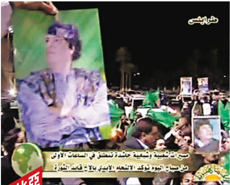
示威者高舉鐵腕統治40年的卡扎菲海報，在的黎波里遊行。

中東示威浪潮首次蔓延至北非國家利比亞，第2大城市班加西，數百名反政府示威者前日深夜與親政府人士爆發衝突。警方遭示威者擲石和汽油彈，遂發射催淚彈、水炮和橡膠子彈還擊，造成38人受傷。反政府人士模仿鄰國埃及和突尼斯模式，在facebook等社交網站號召群眾今日發動「憤怒日」大示威。