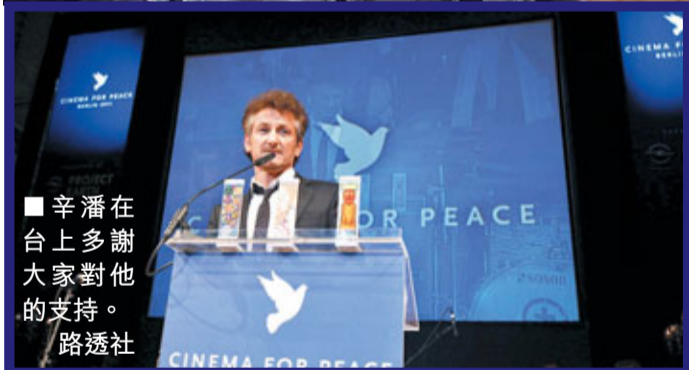
■辛潘在台上多謝大家對他的支持。路透社