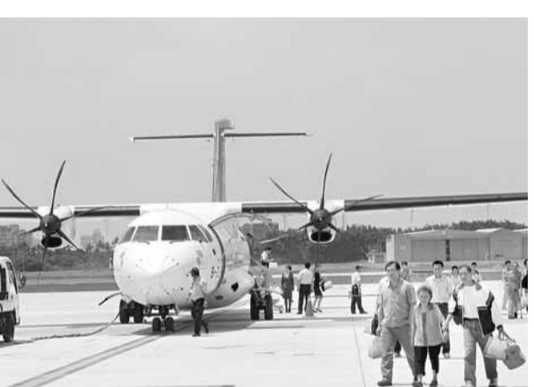
■屏東機場使用率一直偏低，農民和老人是機場乘客的特色。

政治人物過去都以爭取興建機場為「政見」，濫開政策支票。高鐵通車後，島內航線被「打趴」，但機場仍要運作，其中又以屏東機場情況最嚴重。在小港機場及高雄通車重磁效應下，北屏線載客率狂跌，56人座的飛機經常只坐了十多名甚至個位數的旅客。