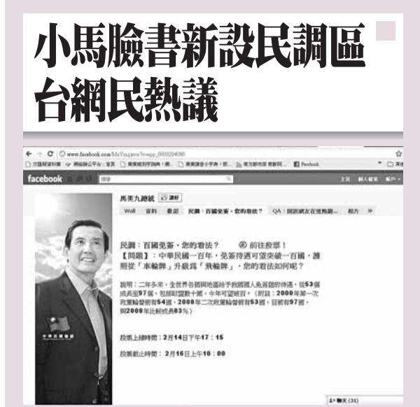
■小馬哥臉書上的民調專區。網上截圖

香港文匯報訊 馬英九臉書(Facebook)專頁15日有新嘗試，開設了民調專區，作為聽取網友意見的管道。