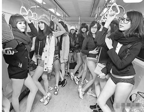
■有運動品牌15日發起「無褲日」，20名正妹下身只穿內褲搭台北捷運。網上圖片

香港文匯報訊 台媒報導，有運動品牌15日發起「無褲日」，邀請20名身材火辣的辣妹下半身只穿內褲搭台北捷運板南線，辣妹們上午9時許在忠孝復興站上車，帶著甜美笑容，大方裸露修長美腿，引來不少男士行「注目禮」，有人好奇直看，卻又顯得有些不好意思，有年輕人拿出相機搶拍，有人忍不住問：「這樣不冷嗎？」 該品牌的行銷經理說，2002年於美國紐約地鐵發起的無褲日，目前有50多個城市響應，主要主張釋放生活壓力，該公司希望把這種巷口運動帶進台灣，並呼籲有興趣的民眾加入。