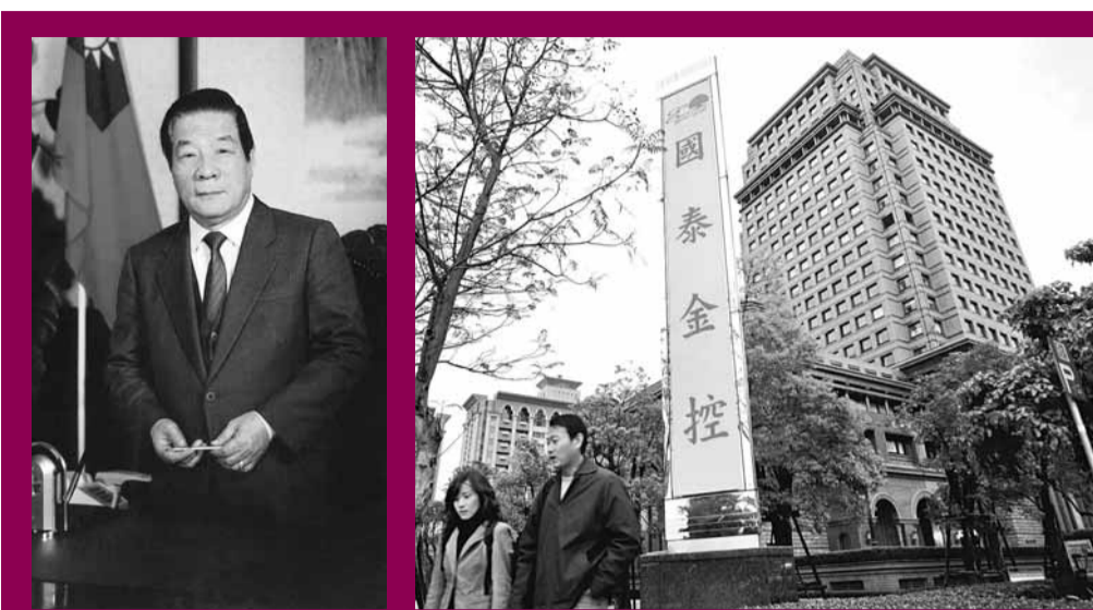
▲已故台灣首富蔡萬霖(左圖)的兒子蔡宏圖打理的國泰金控(上右圖)，資產總值僅次於鴻海集團。資料圖片

蔡萬霖與兄長蔡萬春、弟蔡萬才共同創辦國泰集團，蔡家還有蔡萬生、蔡萬德2名兄弟及蔡玉申、蔡玉蘭、蔡玉梅3名姊妹；1979年蔡萬霖另創霖園集團，旗下事業包括國泰金控、國泰建設等，曾經是台灣首富。2004年蔡萬霖過世後，由次子蔡宏圖接掌國泰金控，去年福布斯公佈蔡宏圖資產約1701億新台幣，在台灣僅次於鴻海董事長郭台銘。