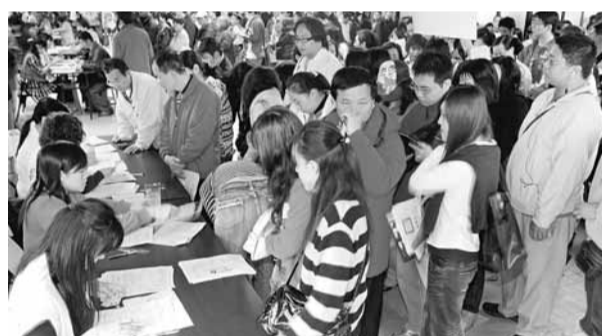
■台灣面臨人力荒，不過業者指求職者亦面對困難。