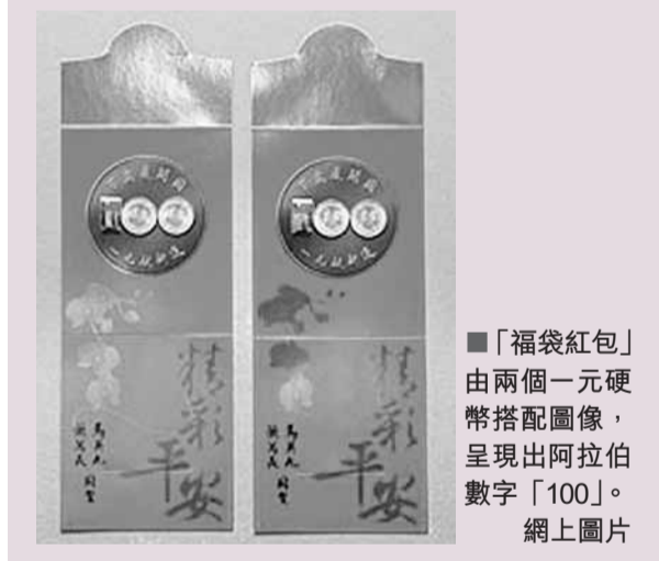
■「福袋紅包」由兩個一元硬幣搭配圖像，呈現出阿拉伯數字「100」。網上圖片

福袋紅包推出不同版本，不僅一般民眾想要到手，網絡上的賣家已經準備排隊搶商機，在網絡上喊出999元的炒賣價。