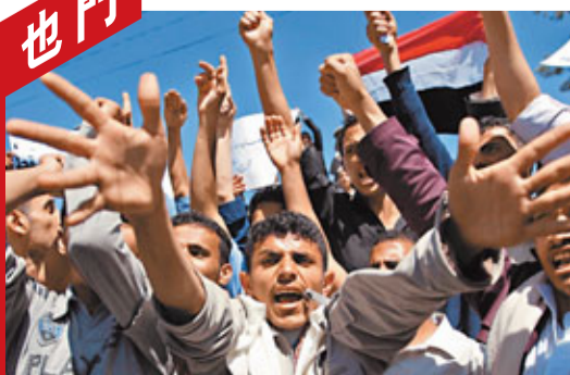
也門示威者喊口號要求總統下台及政治改革。美聯社

(約5.85億港元)的訓練計劃，上月又付運4架直升機給也門，並協助訓練該國飛行單位。 ■路透社/美聯社