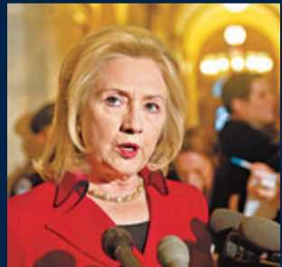
美國國務卿希拉里呼籲伊朗尊重人民表達意見的自由。

網站facebook設立一個名為「25 Bahman」(伊朗曆法的其中一個月份)的專頁，鼓勵民眾上街。 美國國務院日前開設Twitter的波斯語帳戶，聲稱希望透過這種伊朗官方語文發出短訊，與伊朗人民直接「對話」交流，但美國的留言帶有濃厚政治訊息，包括要求伊朗當局容許人民和開羅人一樣可和平集會，明顯是要煽動民眾上街。 ■《泰晤士報》/英國廣播公司