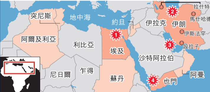
一月至今發生動盪的國家 動盪最新進展