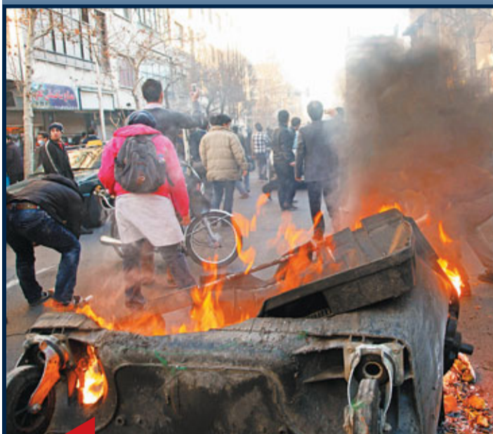
伊朗示威者聚集，並焚燒垃圾桶。

席捲中東的示威浪潮進一步蔓延，伊朗反對派前日號召全國大示威，聲稱有數萬人參與，是2009年反對派抗議總統艾哈邁迪內賈德連任總統以來，該國最大型示威活動。伊朗媒體表示，有2人在警民衝突中死亡，另有多人受傷。媒體譴責示威者為「支持君主政體的暴民和偽君子」，當局揚言將強硬應付。