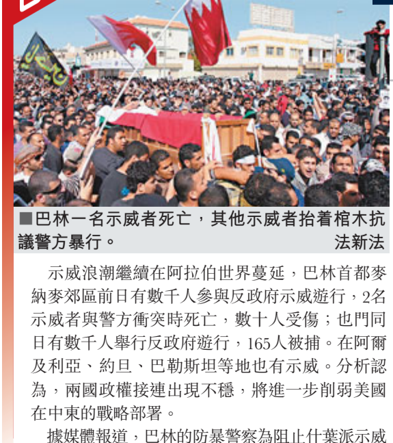
巴林一名示威者死亡，其他示威者抬着棺木抗議警方暴行。法新社

析指反對派遭長期打壓，需要1年或以上重建及為大選準備。目前唯一作好參選準備的組織是穆斯林兄弟會，若大選在半年後舉行，該伊斯蘭教政治團體將會勝出。 埃及工會前日發起全國大罷工，抗議低薪和工作條件差，有數千人參加，外界預料軍方將以更強硬手段穩定社會秩序。最高軍事委員會昨警告，埃及經濟已陷入癱瘓，進一步罷工將危害經濟。埃及內政部前天表示，自上月25日爆發暴亂至今，最少有32名警員死亡，逾1,000名警員受傷。 ■美聯社/法新社/路透社