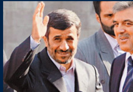
伊朗總統艾哈邁迪內賈德。

伊朗出現自2009年以來最大型反政府示威，除了是受到突尼斯、埃及等國「啟發」之外，最重要還是本身的經濟問題。分析認為，伊朗的通脹率高達11%，政府卻大減對百姓的補貼，反而近年出現一些效忠政府的暴發戶，生活繼續奢華。貧富差距日益擴大，正是激發民憤的主要原因。 百姓補貼減 暴發戶奢華 去年12月，伊朗總統艾哈邁迪內賈德提高麵粉、汽油、天然氣、電力和食水的價格，麵粉價格累積上升40倍，汽油上升4至7倍，天然氣上升5倍，電力和食水上升3倍。加上補貼大減，平民購買力大幅下跌，導致民怨四起。 另一方面，自2003年油價不斷飆升，伊朗當局有意建立對政權忠誠的