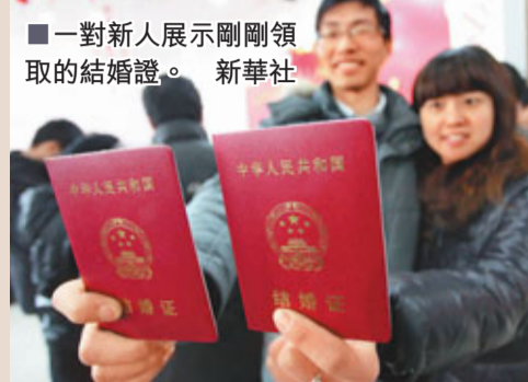
■一對新人展示剛剛領取的結婚證。

只要有新浪微博的賬號，在發佈裡「@」隨手拍解救大齡女青年或者隨手拍解救大齡男青年，附上急待被解救者的照片和個人介紹，經過這位「隨手拍」的轉發後，就能被全國各地的博友看到。「小小的轉發，卻是大大的造化，何樂而不為？」發起人這樣說。這位隱藏在幕後的高手，不分晝夜地轉發各種單身男女的照片和個人介紹，希望幫助他們在情人節到來之際脫離單身的苦海。