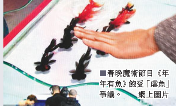
■春晚魔術節目《年年有魚》飽受「虐魚」爭議。

魔術師傅東來在春晚上表演魔術，使6條金魚走方陣，不少人質疑該魔術或使用了磁鐵植入、魚線操控和電流刺激等方式。傅東來早前則向媒體澄清，自己的魔術是將中國傳統的古戲法結合了高科技，並沒有傷害魚類。「我只能說是真魚，我用魔術方法馴化了金魚，我可以很負責任地告訴大家，牠們活得很開心。」傅東來如此表示，但他坦言不會透露魔術的玄機。