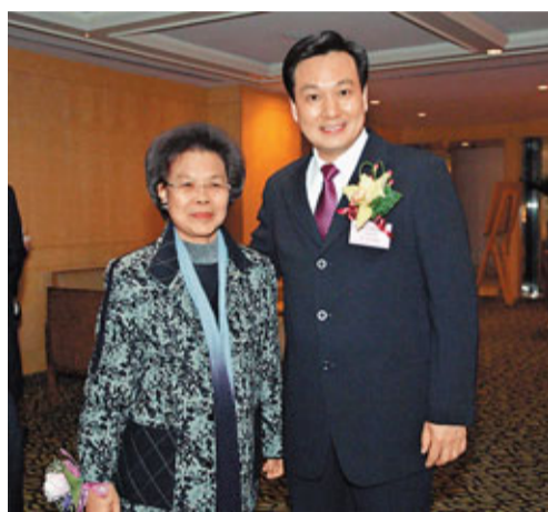
林武部長與前中聯辦副主任陳鳳英合照。