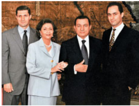
穆巴拉克一家人,長子阿拉(左)及弟弟賈邁勒(右)。 資料圖片

埃及傳媒報道,前總統穆巴拉克上週四錄製最後一次電視講話期間,他的兩名兒子曾經在總統府內幾乎大吵一場,長子阿拉不滿弟弟賈邁勒用人唯親激起民憤,結果導致父親晚節不保。其他高級官員立即勸止兩兄弟,但報道無說明消息來源,事件未能證實。