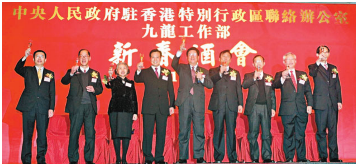
中聯辦九龍工作部昨舉行新春酒會。圖為賓主祝酒。

香港文匯報訊(記者 解玲)中央人民政府駐港聯絡辦九龍工作部昨日於尖沙咀洲際酒店宴會廳,隆重舉行2011年新春酒會,政商名流、九龍區各界人士逾1,300人濟濟一堂,場面相當熱鬧。中聯辦副主任周俊明、全國人大常委香港基本法委員會副主任梁愛詩、外交部駐港特派員公署副特派員李元明、立法會主席曾鈺成、特區政府民政事務局長曾德成出席並主禮。周俊明帶領眾嘉賓祝酒,祝福國家更加富強,香港更加繁榮。