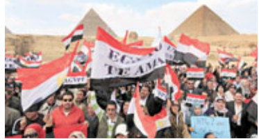
令當地旅遊業大受打擊。

埃及各地爆發工潮,就連數百名在吉薩平原任職的金字塔導遊亦不例外。不過他們並非要求加薪,而是希望擺脫示威陰霾,呼籲海外旅客再次到埃及遊覽。報道指,數百名金字塔導遊昨日在吉薩平原上拉起橫額(見圖),上面分別用英、法、俄和德文寫上「埃及愛你們」,他們又逐一以各國語言呼籲遊客回歸。不過現場所見,只有少數埃及本地遊客在場,鮮見海外遊客蹤影。自從埃及爆發反政府示威後,很多國家都對埃及發出旅遊警