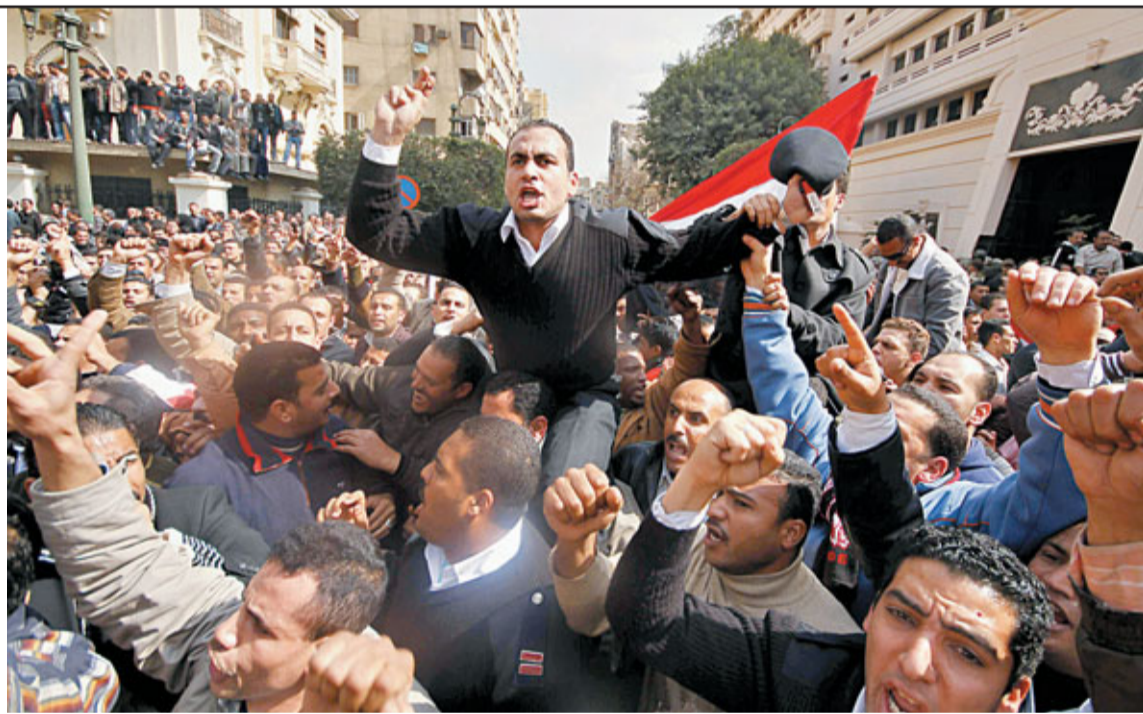
開羅警員加入示威,揮動制服及襟章,其中部分人要求政府加薪。