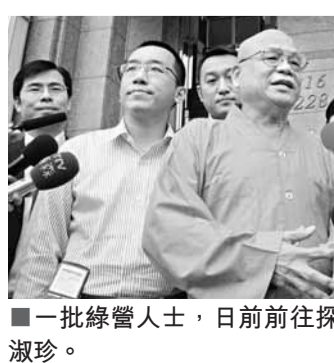
一批綠營人士，日前前往探視抱恙的吳淑珍。