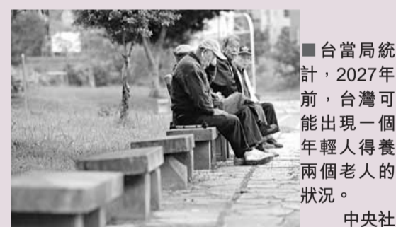
台當局統計，2027年前，台灣可能出現一個年輕人得養兩個老人的狀況。中央社

香港文匯報訊 據台灣《聯合報》報導，台當局「主計處」統計，台灣的潛在勞動力佔非勞動力人口的比率，去年只剩下70.6%，創下歷史新低紀錄，如同「勞動力儲蓄簿」餘額已降到史上最低，凸顯島內「少子化」與「老齡化」惡果逐漸浮現。2027年前，台灣可能出現一個年輕人得養兩個老人的狀況。