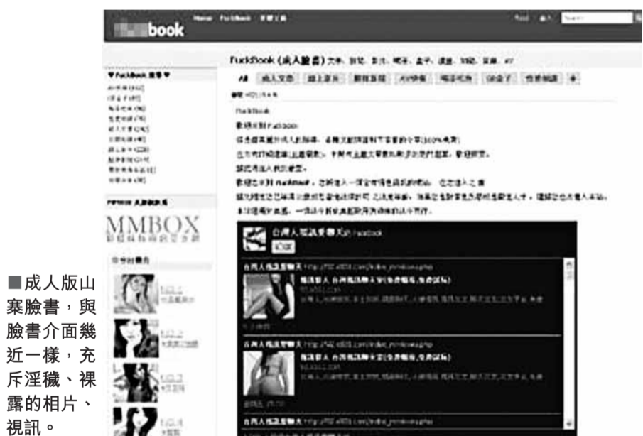
成人版山寨臉書，與臉書介面幾近一樣，充斥淫穢、裸露的相片、視訊。

不過，受理的警方指出，成人臉書的伺服器經查確實架在美國，在台灣「無法可管」，但如果民眾上傳涉及妨害風化的圖片及影像時，或是業者有販售違法色情影片，警方還是會循線追出在台的非法行徑。