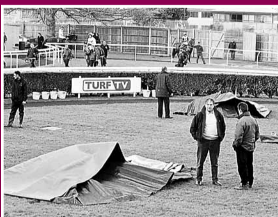
■ 賽馬場工作人員用帆布覆蓋兩馬匹的屍體。