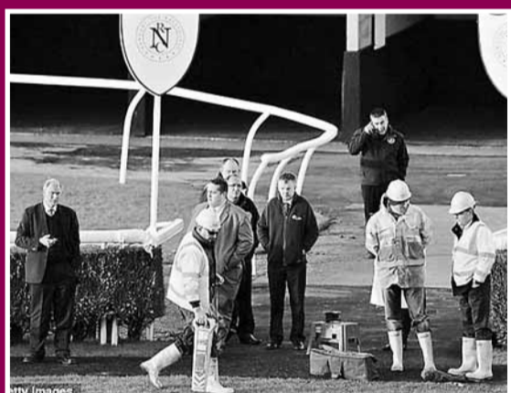
■ 電力工人到馬場檢測地下電纜是否損壞。