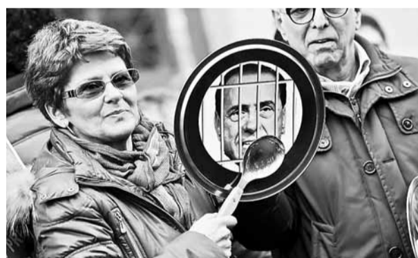
■ 羅馬一名示威婦女拿着鐵勺，敲打貼有貝盧斯科尼照片的鐵鑊。