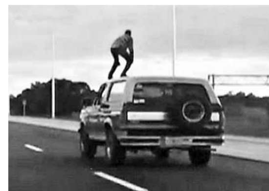
■ 韋哈格在高速公路上爬上車頂。