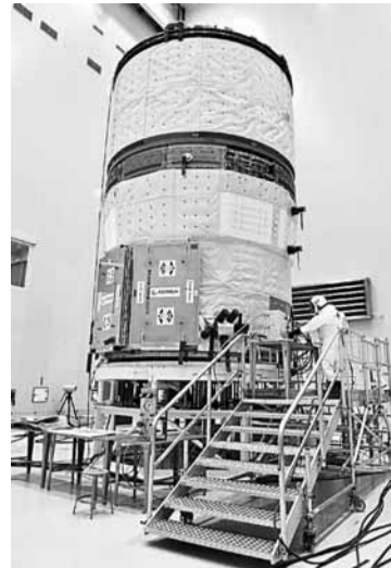
■ 工作人員為Johannes Kepler進行升空前檢查。