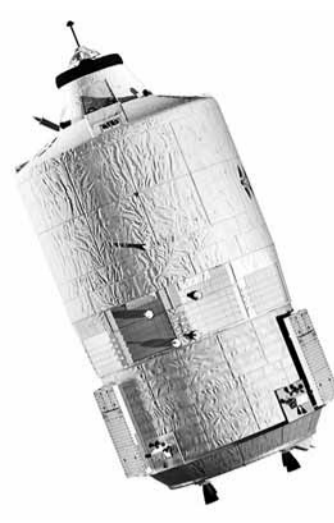
■ Johannes Kepler外貌。