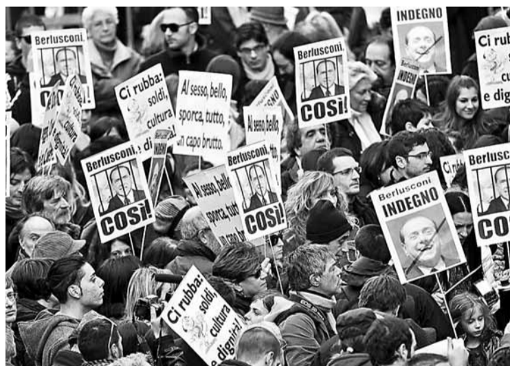
■ 昨日意大利200個城市均有示威活動，抗議總理貝盧斯科尼的言行蔑視女性。圖為示威者手持標語，在羅馬街頭遊行。