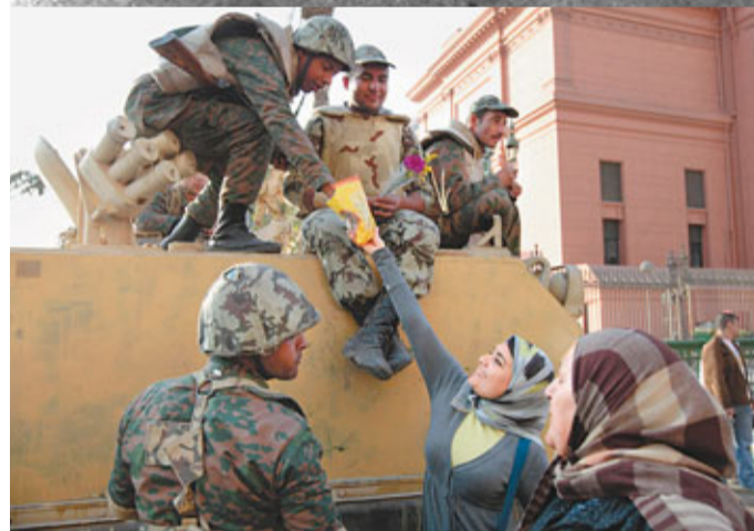
軍方與民眾仍然和睦相處，但埃及要步向民主，軍方取態成為關鍵。