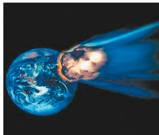
■小行星撞地球效果圖。

據中新社13日電 對近期網間「2036年小行星撞地球」消息，中國科學院紫金山天文台研究員王思潮13日告訴記者，僅為二十五萬分之一的概率是極低的。但他預計，未來50年內，小行星撞擊地球的概率是百分之一。