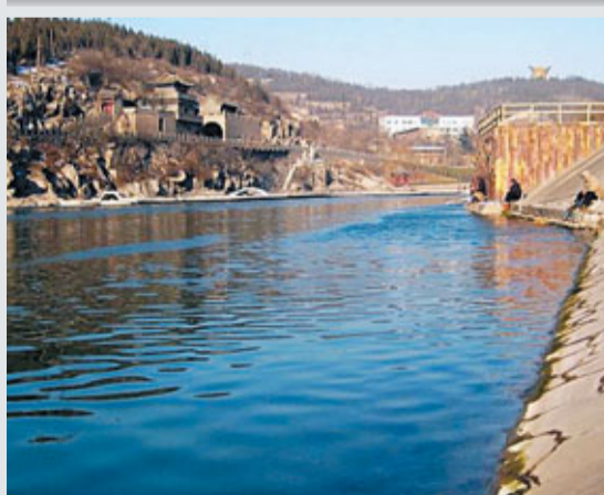
河北邯鄲市「母親河」滏陽河

香港文匯報訊（記者 張帆 石家莊報道）記者近日獲悉，今年河北邯鄲市將投資21億人民幣對境內5條河流的城區段進行綜合治理。其中滏陽河投入達9億元人民幣，對馬頭至永年縣段60餘公里河道進行治理，拓展提高滏陽河的防洪水平，營造生態水面和生態景觀。據介紹，該市將按照「全面規劃、綜合整治、分期、分級、分區、分段治理」的原則，在河岸建設開發水源涵養區、生態防洪區、城鄉宜居區、高效農業區、生態風景區、人文景觀區，打造「五河繞城」的北方水城美景。