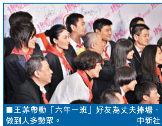
■王菲帶動「六年一班」好友為丈夫捧場，做到人多勢眾。