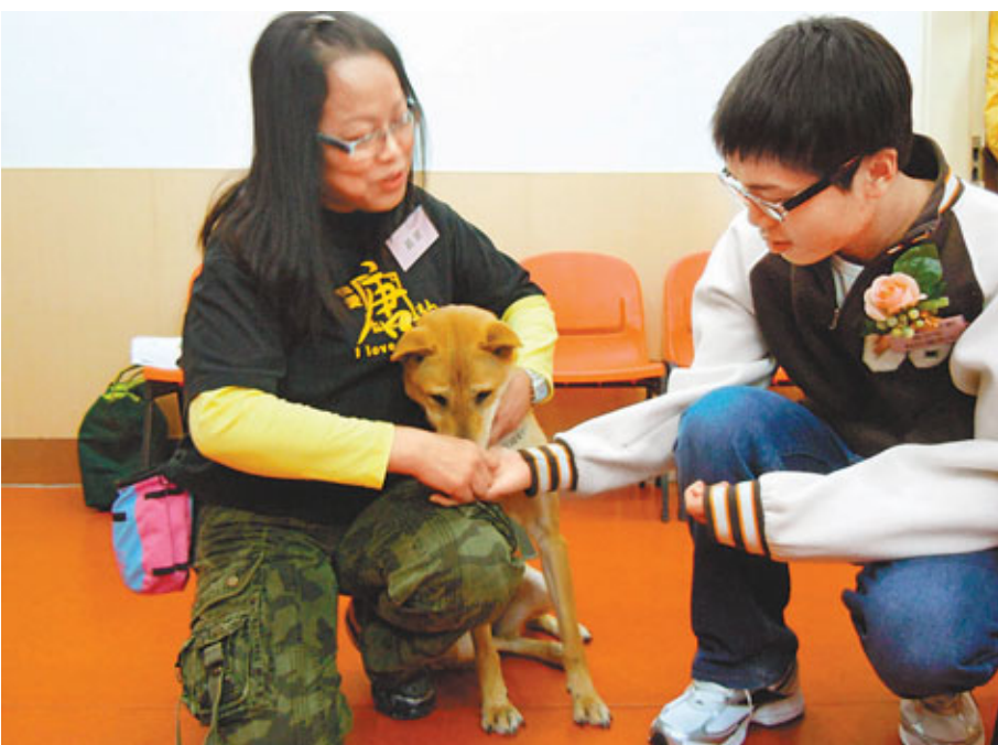
隱青在義工的鼓勵下，與狗交流，消除心理障礙，建立自信。

參加計劃的隱青初時可輕摸狗醫生、狗大使，甚至可與狗隻玩互動遊戲，讓她跳圈和跳腳。很多隱青初時都不敢接觸狗隻，但一旦打破隔膜，他們便會更主動跟狗玩耍，社工和義工亦會鼓勵他們嘗試，有隱青甚至會主動詢問義工關於狗隻的性格和習性，與義工聊天交流。