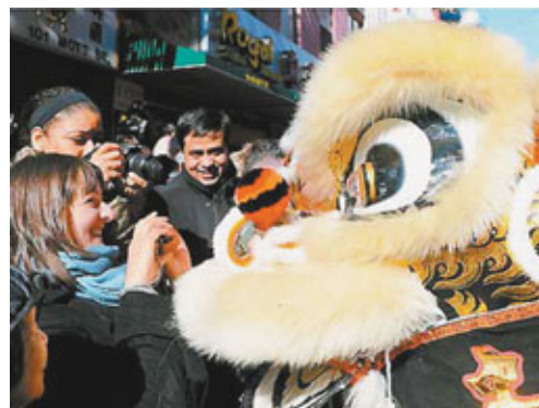
美國出生的華裔中有約一半出生在加州和紐約。圖為紐約唐人街舞獅慶祝兔年春節。

美國華人全國委員會與馬里蘭大學美籍亞裔中心前日聯合發布的「2011年美國華裔人口動態研究報告」顯示，截至2009年，美國華裔人口達到363.9萬，佔美國總人口的1.2%，佔美國亞裔人口的比重達到22.2%，比2000年增加33.3%。