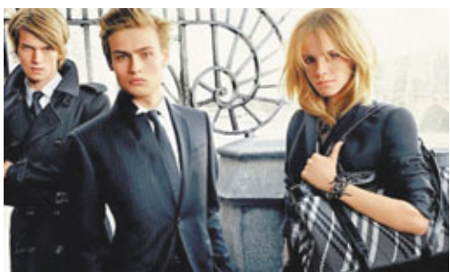
英國名店Burberry的模特兒展示旗下產品。升155%，現時差不多全部店舖都請了普通話店員。她說：「我們訓練店員要懂中國禮儀，例如把信用卡交還給顧客時，一定要雙手奉上。」