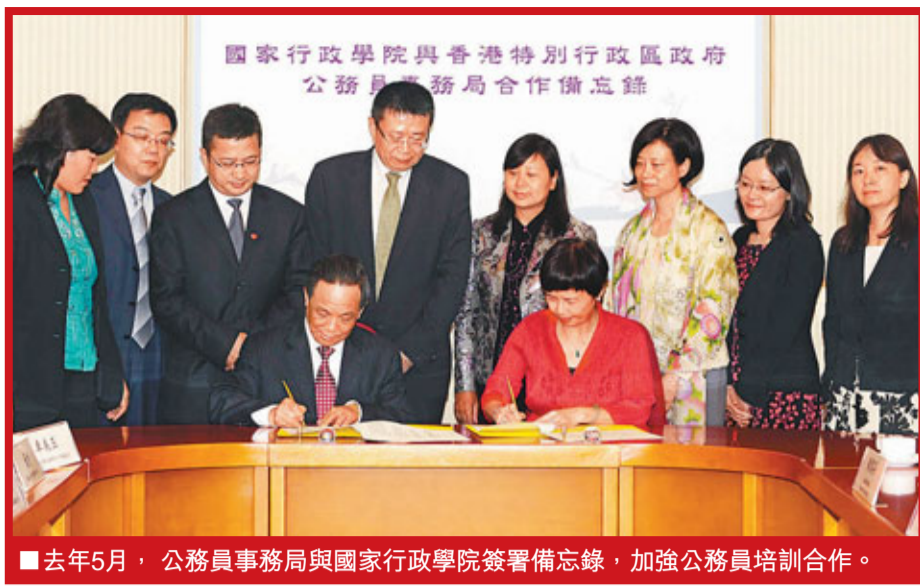
■去年5月，公務員事務局與國家行政學院簽署備忘錄，加強公務員培訓合作。

香港文匯報訊（記者 王珽、王添翼，實習記者 張夜薇 北京報導）位於北京市海澱區長春橋的國家行政學院北門附近，一大片紅白相間的嶄新建築群矗立在車水馬龍的西三環之側，這是在國家行政學院內，斥資逾2億元興建的港澳公務員培訓中心，歷時兩年建設，將在今年上半年正式啟用，以迎接更多港澳公務員北上學習國情、增進對祖國的了解和文化認同。