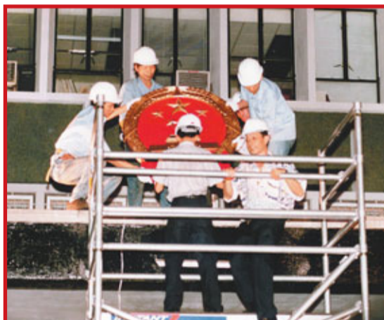
■1997年香港回歸祖國，政府總部換上中國國徽，兩地公務員合作交流日益密切。

清華大學的香港高級公務員國情培訓則分為小課堂和大課堂兩個部分，小課堂就是緊密圍繞香港、內地、世界、兩岸關係等方面的政策時勢，在清華大學校內聆聽知名教授和政要專家對相關問題的講授。大課堂就是在清華大學之外實地參與和進行觀摩、訪問和考察。香港班學員的足跡遍及祖國各地，西部大開發政策提出後，他們把學員帶到了江西南昌；振興東北老工業基地提出後，他們組織學員考察了遼寧瀋陽；新的《國家衛生城市考核辦法》頒布後，他們又帶學員訪問了新近榮膺「國家衛生城市」稱號的洛陽。學員們深入農村民居，走進工廠車間，旁聽新聞發佈會，旁聽法院的審判，活動的課堂讓大家更加貼近了祖國的肌體，零距離感受了中華母親發展的脈搏。