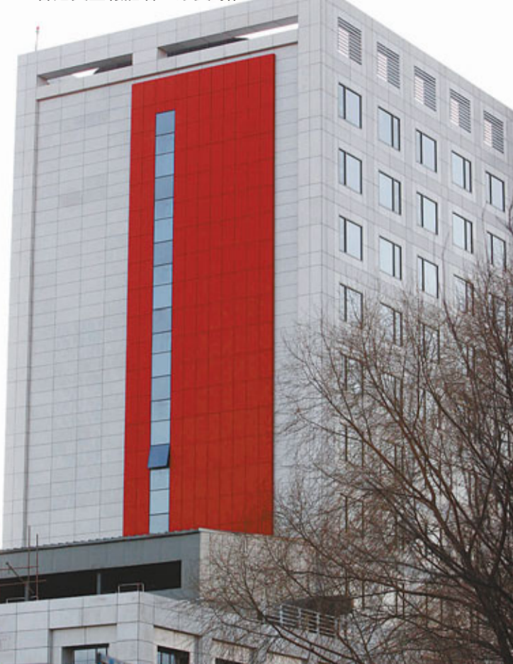
■國家行政學院港澳公務員培訓中心將於今年上半年啟用。