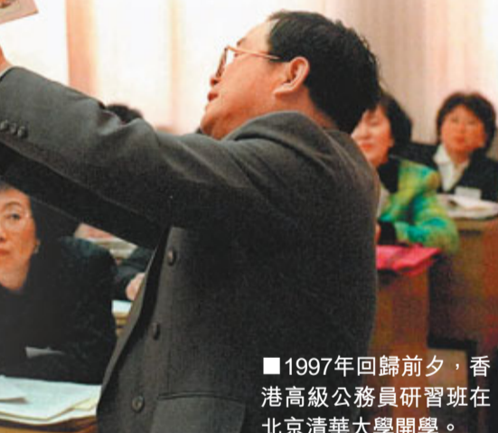
■1997年回歸前夕，香港高級公務員研習班在北京清華大學開學。

另外，去年9月，特區政府公務員事務局局長俞宗怡帶領一眾常任秘書長，首次組團前往國家行政學院，得到高規格接待，並在人民大會堂受到中共中央政治局委員、國務委員劉延東親自會見。劉延東讚揚香港的公務員為香港繁榮穩定、落實「一國兩制」作出重要的貢獻，並希望他們到內地研習，可以更進一步了解國情，提高管治水平，更好為香港及國家服務。