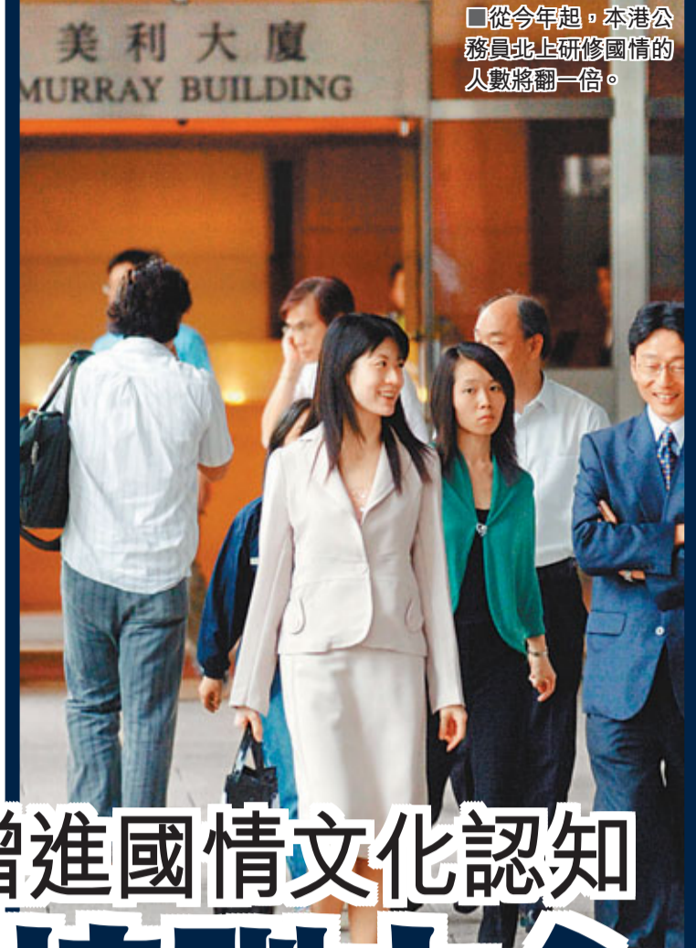
■從今年起，本港公務員北上研習國情的人數將翻一倍。

香港文匯報訊（記者 王珽、王添翼，實習記者 張夜薇 北京報導）位於北京市海澱區長春橋的國家行政學院北門附近，一大片紅白相間的嶄新建築群矗立在車水馬龍的西三環之側，這是在國家行政學院內，斥資逾2億元興建的港澳公務員培訓中心，歷時兩年建設，將在今年上半年正式啟用，以迎接更多港澳公務員北上學習國情、增進對祖國的了解和文化認同。