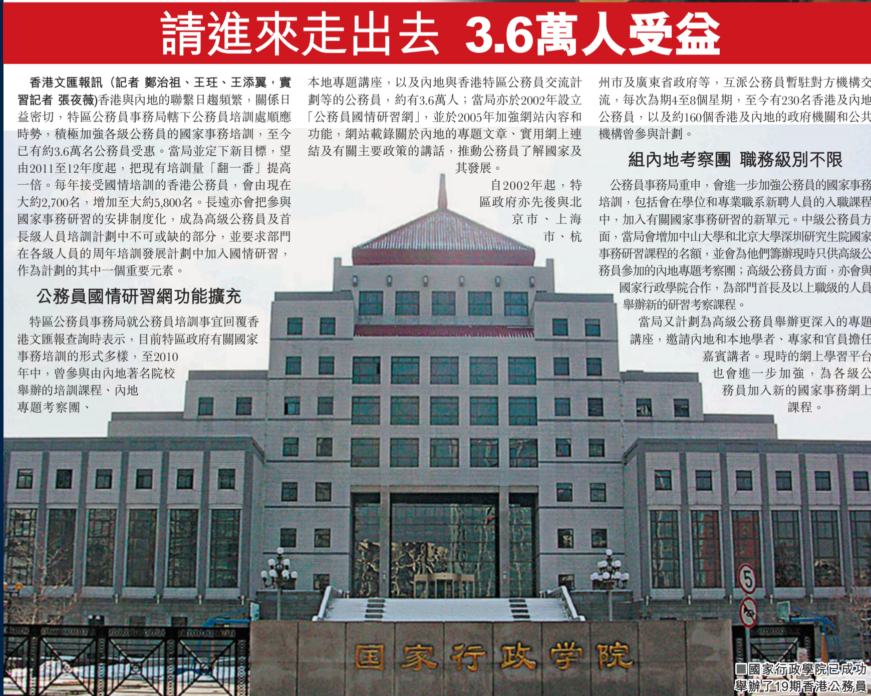
■國家行政學院已成功举办19期香港公務員培訓。圖為學院主樓。

當局又計劃為高級公務員舉辦更深入的專題講座，邀請內地和本地學者、專家和官員擔任嘉賓講者。現時的網上學習平台也會進一步加強，為各級公務員加入新的國家事務網上課程。