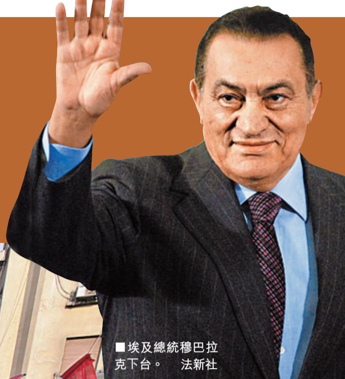
埃及總統穆巴拉克下台。法新社