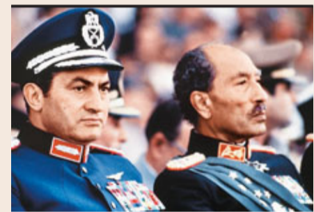
軍人出身的穆巴拉克獲薩達特(右)賞識，並於1981年當上埃及總統。

1949年和1950年先後畢業於埃及軍事學院和空軍學院，後在空軍學院任教官，曾3次赴蘇聯學習，歷任轟炸機中隊長、空軍基地司令、空軍參謀長等職