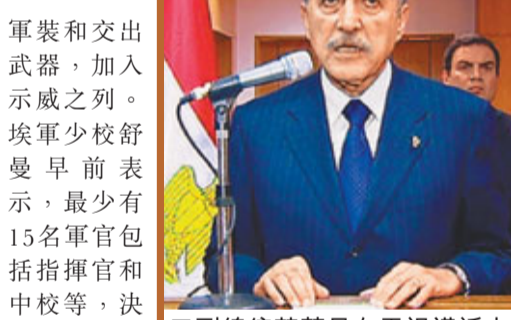
副總統蘇萊曼在電視講話中宣布，穆巴拉克已經下台。法新社

法新社估計，全國至少有100萬人示威，其中逾萬人到內閣、議會和國家電視台大樓外集會，並衝破軍事路障，阻止電視台員工上班。開羅解放廣場亦有數萬人示威，3名軍人脫下