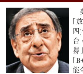
美國中央情報局(CIA)局長帕內塔(見圖)前天「放流料」，稱埃及總統穆巴拉克「很可能今天(周四)傍晚下台」，結果穆巴拉克只宣布交權並未下台。CIA大失面子，國家情報總監克拉珀隨即「死撻」，指美國情報人員在埃及的情報工作表現獲「B+」評分，又稱他們能預測埃及局勢不穩，但不能令「不穩」消失，說：「我們不是『神算』。」

帕內塔預測失準，有官員指其言論只是回應傳媒報道，而非根據情報局的內部情報。不過，參議院情報委員會主席范斯坦又踢爆，本月初情報人員向白宮和議員稱，「無確實警報」顯示埃及將出現不穩。連串「情報失準」，CIA被批評跟不上埃及局勢的急速發展。