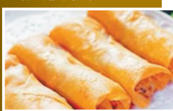
■春卷是著名的廣式小吃。