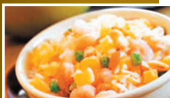
■炒飯不但中國人喜歡，洋人也喜歡。