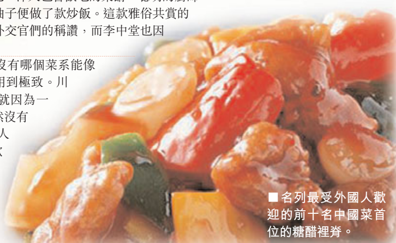
■名列最受外國人歡迎的前十名中國菜首位的糖醋裡脊。

第一道： 糖醋裡脊。這道菜排第一位不奇怪，酸甜混合的味道加上明亮鮮艷的外表，任誰都無法拒絕。