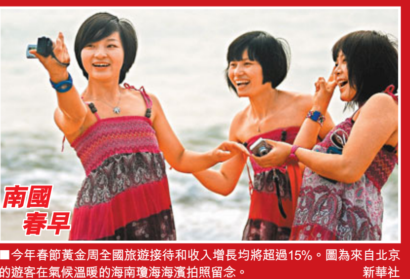
■今年春節黃金周全國旅遊接待和收入增長均將超過15%。圖為來自北京的遊客在氣候溫暖的海南瓊海海濱拍照留念。