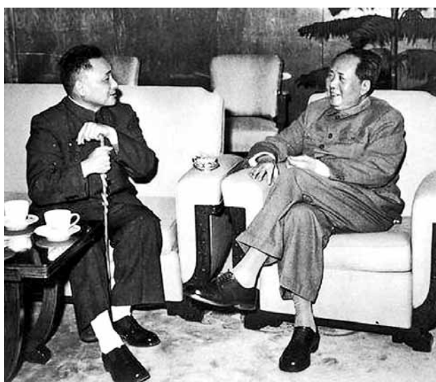
■1960年毛澤東和擔任中共中央總書記的鄧小平談話，以後曾多次講鄧小平「人才難得」。網上圖片