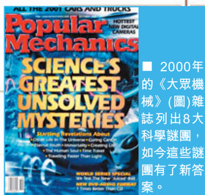
2000年的《大眾機械》(圖)雜誌列出8大科學謎團，如今這些謎團有了新答案。