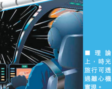
理論上，時光旅行可透過離心機實現。