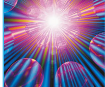
這一速度仍然無法對我們太空旅行提供太大的幫助。2007年的實驗仍然存在爭議。

近年來科學家實施了許多相關的實驗，比如由美國普林斯頓大學科學家王利軍(Lijun Wang)2000年進行的實驗和德國科學家2007年進行的實驗都取得了一定的進展。最初，科學家堅信沒有任何物質或信息能夠突破光速，但光脈衝卻能夠做到。在真空狀態下，在不同位置測到的光脈衝似乎以一種難以置信的速度在傳播。不過，