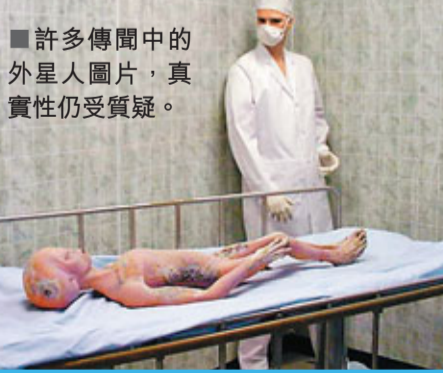
許多傳聞中的外星人圖片，真實性仍受質疑。

數年來，天文學家一直在致力於尋找類地行星。最近，天文學家聲稱他們發現了首顆岩質系外行星，這顆行星大小大約是地球的1.4倍。預計於2015年發射升空的「詹姆斯·韋伯」望遠鏡將為天文學家提供更清晰的外星世界視角。