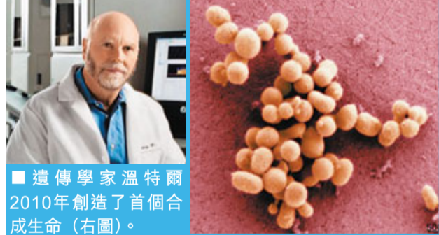
遺傳學家溫特爾2010年創造了首個合成生命(右圖)。

人類至今仍未解開地球的生命之謎，雖然人類目前已大致了解生命的必要成分以及它們所形成的生物分子結構，但如何創造生命，人類認識仍然很模糊。