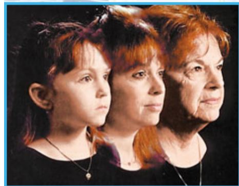
未來延長生命，可能要靠納米科技修復受損組織。圖為一名西方女子的衰老過程。