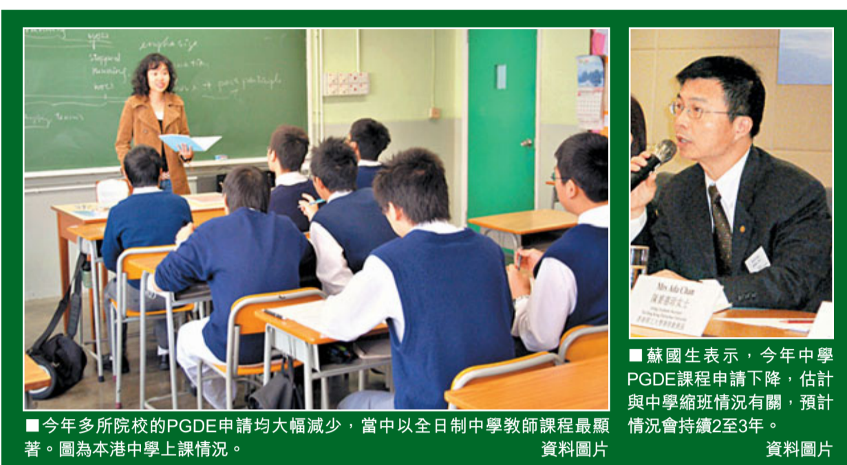
■今年多所院校的PGDE申請均大幅減少,當中以全日制中學教師課程最顯著。圖為本港中學上課情況。資料圖片

香港教育學院教務長蘇國生表示,中學PGDE課程的申請下降,估計與中學縮班情況有關,「畢業生會擔心求職困難,出路受限。這情況在小學殺校潮時亦曾出現,估計中學申請情況會持續下跌2至3年。反之隨着出生人口回升,小學課程的申請情況較樂觀。今年幼兒教育申請情況更大增70%,反映需求殷切。」