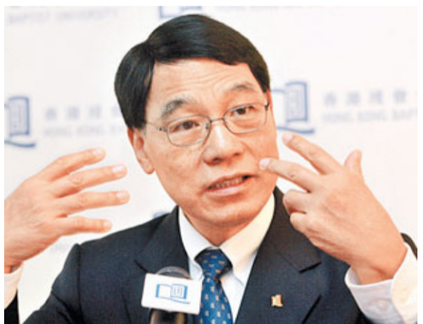
■陳新滋公布「創意研究院」開幕酒會將於3月28日舉行,並邀得3位諾獎得主到浸大與師生交流互動。資料圖片

香港文匯報訊(記者 黃德正)香港浸會大學校長陳新滋上任僅半年,已積極推動學校發展。該校早前公布要建立「創意研究院」,校方原來已敲定於3月28日正式開幕。陳新滋更邀得3位諾貝爾獎得主與師生交流,包括最為港人熟悉的諾貝爾物理學獎得主楊振寧,為「創意研究院」的成立打響頭炮。一向愛好吟詩作對的陳新滋技癢,以《春日感懷》為題撰詩,祝賀浸大55周年校慶;並寄語浸大銳意成為國際一流大學,其「詩人科學家」的韻味溢於言表。