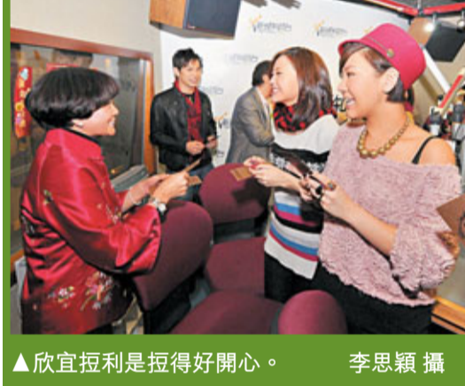
▲欣宜拉利是拉得好開心。