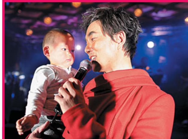
■現場有觀眾熱情得將小孩遞給小齊抱着。