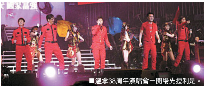
■溫拿38周年演唱會一開場先攞利是。

香港文匯報訊 (記者 李慶全) 《溫拿38大躍進演唱會》於大年初二開騷，一連六場前晚已舉行到第三場，新年氣氛依然濃厚。首晚演唱會設有「鬼拍後尾枕」溫拿五子互爆愛情故事的環節，阿倫被踢爆左擁右抱齊齊人之福，更唱他《Happy Together》，各人沒跟稿讀以致阿倫即時眉頭皺。而報章、雜誌事後出來的報道均集中在這環節之上，隨即幾晚演唱會上，已將阿倫的一段情節刪減，四子都不敢再開口爆料實行低調處理，話題只好轉到B哥哥身上。