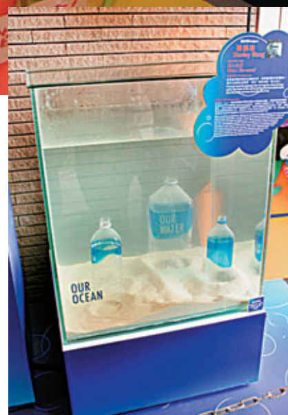
又一山人的《將心比己》。