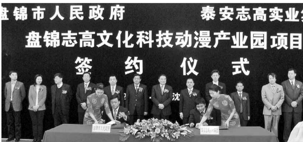
志高文化科技動漫產業園項目簽約儀式現場。

據介紹,志高集團在盤錦市投資項目分為兩個部分。首先,由泰安志高集團與其戰略合作夥伴在盤錦市政府所在地興隆台區投資100億元建設「盤錦志高文化科技動漫產業園項目」,是集主題公園、動漫科技研發基地及交易園區、遊樂項目、休閒項目、大型室內演藝廳