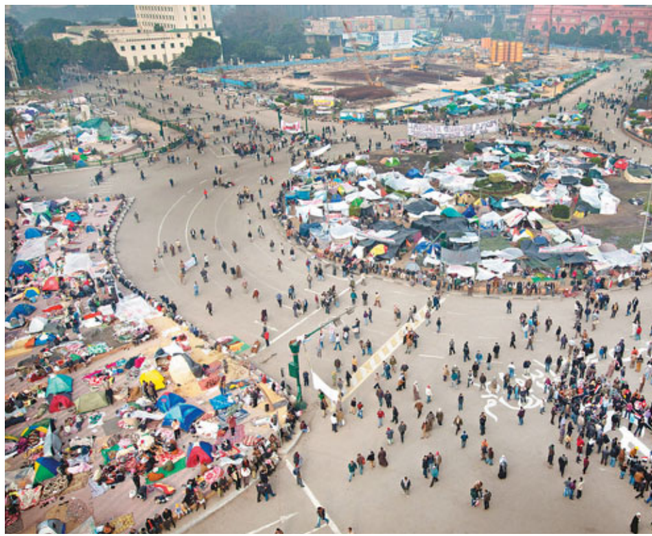
埃及首都開羅市中心的解放廣場，仍有示威者留守。