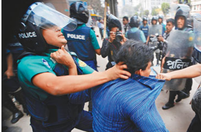
孟加拉防暴警察與BNP示威者在達卡發生衝突。