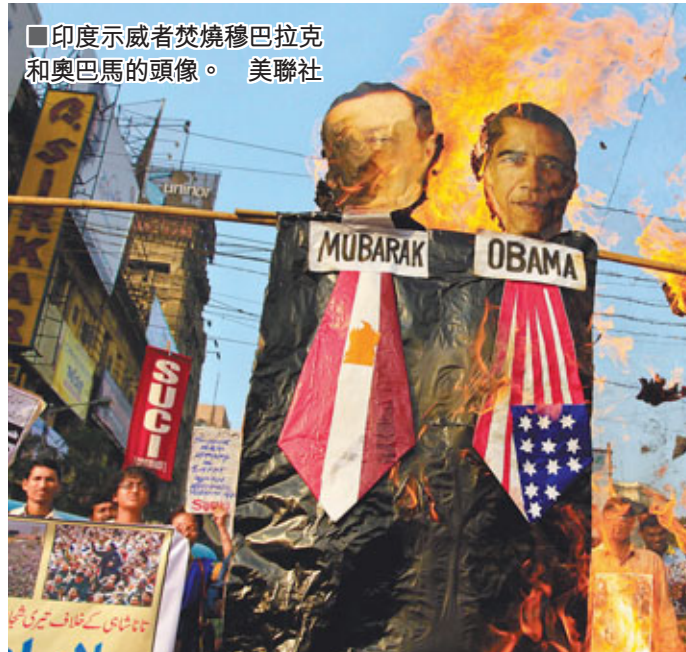
印度示威者焚燒穆巴拉克和奧巴馬的頭像。