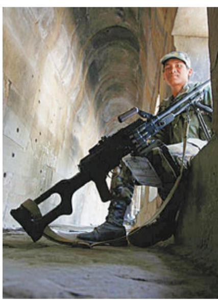
一名駐守在柏威夏寺古跡的柬埔寨士兵在值守。