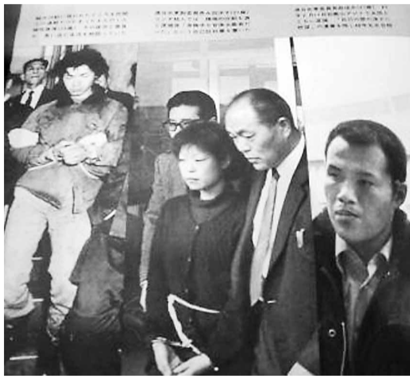
永田洋子1972年被捕，1982年判處死刑。