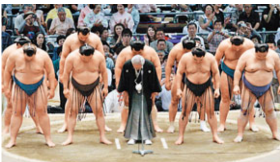
去年夏季大賽開賽前，力士們集體鞠躬，為醜聞向觀眾致歉。

相撲雖被視為日本「國技」，但近年經常爆出涉黑、涉賭、涉假等醜聞，形象一落千丈。日本內閣官