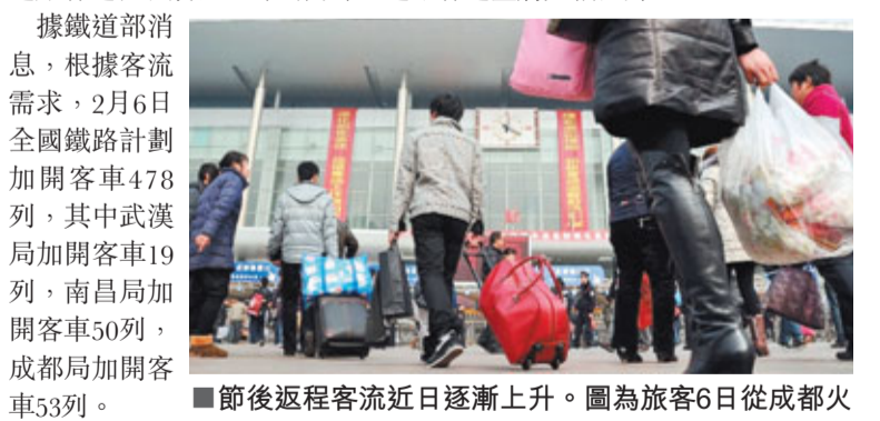
節後返滬客流近日逐漸上升。圖為旅客6日從成都火車站前走過。

6日是大年初四，進京、進滬、進穗和短途客流明顯上升。鐵道部相關負責人表示，目前各區域間、大城市間旅客列車都有餘票。7日中長途客流將全面啟動，預計客流高峰將出現在2月8日(正月初六)至2月12日(正月初十)。此外，春節黃金周的後三天，道路運輸也將迎來探親、旅遊旅客返程和農民工外出高峰，道路客運量將大幅回升。