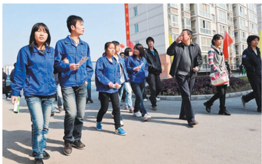
內地政策引導企業到西部設廠，產生人力磁吸效應，造成沿海缺工。圖為富士康鄭州工廠的員工生活小區。資料圖片

整體來看，過去內地缺工問題多半發生在農曆春節前後，今年提前，若扣除天候因素，「十二五」規劃有關城鄉及東西部的均衡發展，以及富士康集團內地招工及廠商西進，都是進一步使沿海缺工問題惡化的長期潛在因素。