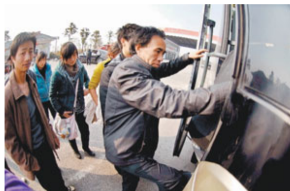
6日，來自貴州的務工人員在滬昆高速江西新余服務站內排隊上車，前往浙江打工。新華社

江蘇海瀾集團是一家員工過萬的服裝企業。這家企業在去年年底，一次性拿出近4,000萬，出資了一系列善待員工的政策。按最新標準計算，工作滿一年的生產線員工年收入可增加3,000多元，工作滿五年的生產線員工年收入可增加近8,000元，部分工種甚至可增加近萬元。江蘇海瀾集團人力資源部部長說，重要的是，從員工進入企業開始，企業就為員工制定好職業規劃，培養他們的歸屬感。