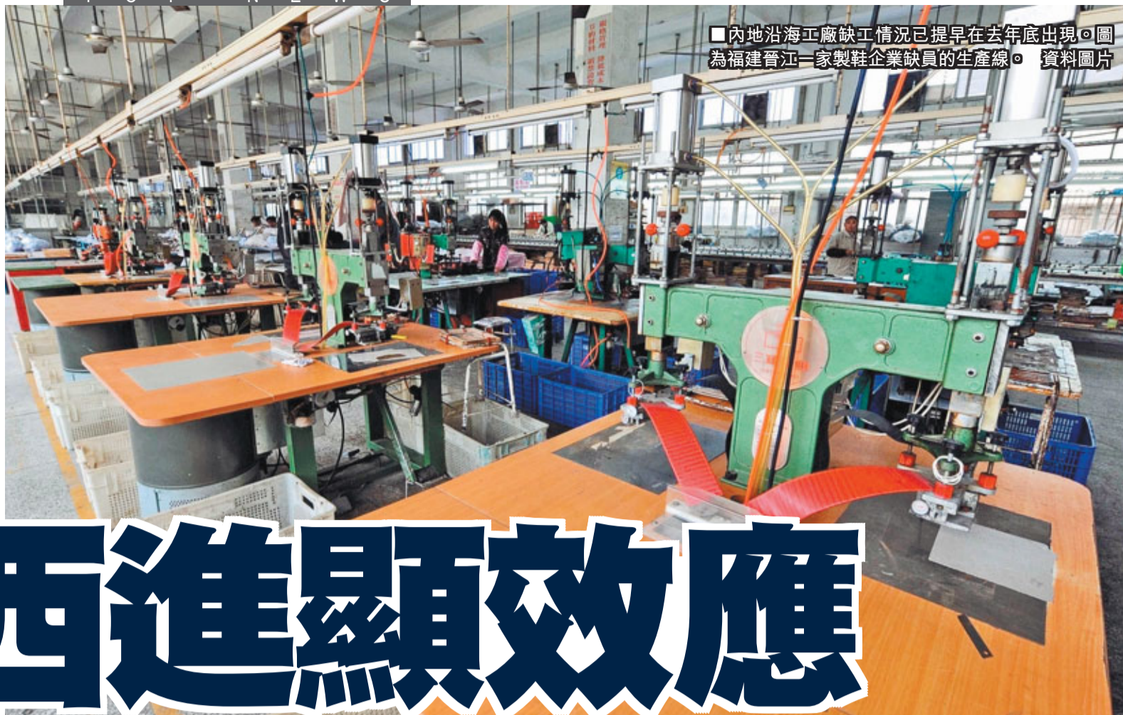
內地沿海工廠缺工情況已提早在去年底出現。圖為福建晉江一家製鞋企業缺員的生產線。

同時，今年食品價格的上升使得農民種糧的積極性有所激發。中國之聲特約觀察員馬光遠認為，農村能提供的廉價勞動力會越來越少，這一現象在二代農民工中更為典型。馬光遠指出，他們有知識有理想，他們渴望留在城市，而不是像他們的前輩一樣掙點錢回到農村改善他們的生活，這是決定未來整個企業用工，勞動力供給與需求之間是否出現失衡的重要原因。