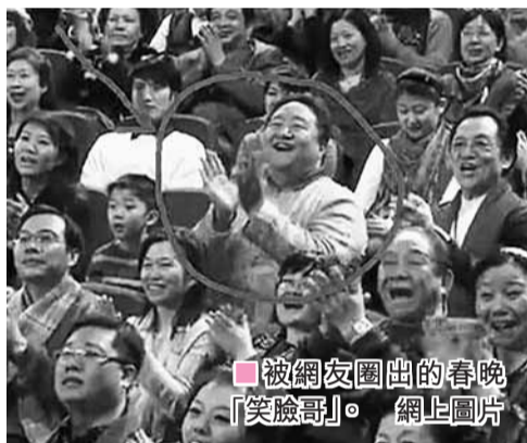
被網友圈出的春晚「笑臉哥」。

日前，有網友總結出一份「與2011年春節相關的十大銳詞」表單。這十大銳詞分別是——「春節恐歸族」、「讓愛回家」、「免手勢」、「2加4式團圓」、「電子年貨」、「交換年貨」、「拼桌年夜飯」、「網絡春晚」、「春晚釘子戶」、「春晚後遺症」。