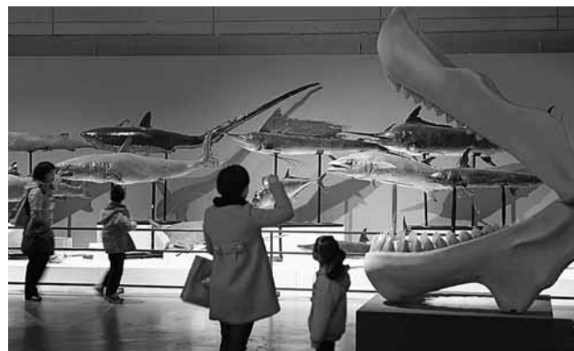
閉門守歲、作揖拜年等舊俗漸漸被取代。圖為杭州市民春節期間去自然博物館參觀展覽。 新華社

春節新風俗——變革中的中國文化張力 當自稱為「最洋氣的中國人」的大山登上了中國兔年春晚的舞台，用流利的中國話表演脫口秀，電視機前億萬觀眾並沒感到不適。中國人似乎很樂意讓更多外國人共同享受春節的歡樂。 「看春晚、短信拜年、旅遊過年逐漸成了中國春節的新風俗，過去閉門守歲、作揖拜年等舊俗漸漸被這些新風俗取代了。」武漢大學比較文學系教授徐險峰說，現代春節是工業文明和商業文明共同孕育的節日文化現象，植根於農耕文化的原始氣息正在稀釋。