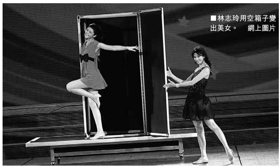
林志玲用空箱子變出美女。

形、解散。有網友第一時間用微博對馴魚魔術進行了揭秘，甚至有些網友認為傅琰東「虐魚」。最先揭秘的文章稱，魔術的秘密在於幾條金魚的肚子裡事先放入了鐵塊，水盤下裝置了磁鐵，由於盤中的水很淺，演員可以通過控制磁鐵的開關指揮魚在水中行進，一旦關閉磁鐵，魚就可以自由游動。還有網友表示此魔術是通過隱藏在天花板的魔術師助手，利用魚線和魚食引誘金魚游動。另有一些網友認為，在一定強度的直流電場中，魚受到電流刺激後，會將身體轉向陽極，並向陽極游去，當把電流方向轉換，魚也會調轉方向，在交流電場中，魚群則出現停滯不前。 「很多人詢問關於網絡上揭秘的所謂殘忍表演是否屬實，我可以很負責任地告訴大家，它們(金魚)活得很開心。」傅琰東主動發微博否認「虐魚」。傅琰東說，自己有一次看古書發現了馴魚這個節目，長期研究後想出一套「馴魚方法」。「我只能告訴你，魚是真魚，我用魔術方法馴化了它們。」他沒有透露自己看的是哪部古書，他表示理解大家的好奇心，同時希望保留魔術的神秘。