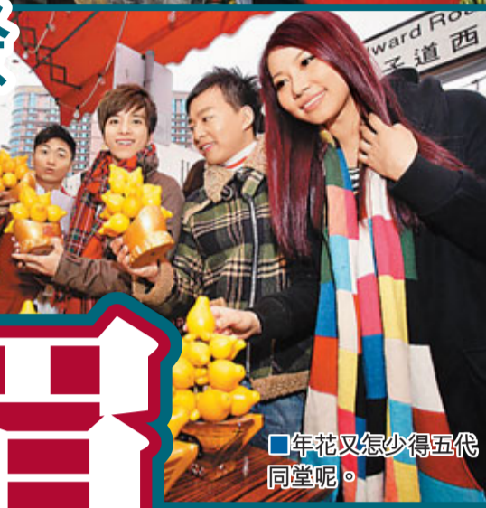
年花又怎少得五代同堂呢。