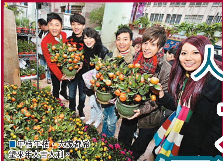
年桔年桔，大家都希望來年大吉大利。