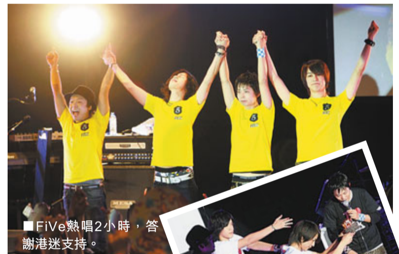
FiVe熱唱2小時，答謝港迷支持。

香港文匯報訊(記者 陳敏娜)由主音兼結他手中江川力也、低音結他手上里亮太、鼓手牧野紘二和鍵盤手石垣大祐組成的粵尼事務所實力派樂隊FiVe，繼10年來港為同門組合Kinki Kids個唱演奏後，近日再度來港為師弟山下智久的個唱演出，前晚更在九龍灣國際展覽中心舉行首個演唱會，獲近400名歌迷到場支持。