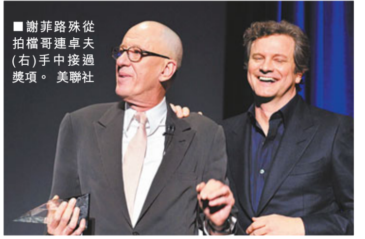
謝菲路殊從拍檔哥連卓夫(右)手中接過獎項。

性格奧斯卡影帝謝菲路殊(Geoffrey Rush)日前憑《皇上無話兒》入圍奧斯卡最佳男配角後，於美國時間1月31日，獲2011聖芭芭拉國際電影節(Santa Barbara International Film Festival)頒發蒙特西托獎(Montecito Award)，表揚他在影壇上的成果，雙喜臨門，可喜可賀。