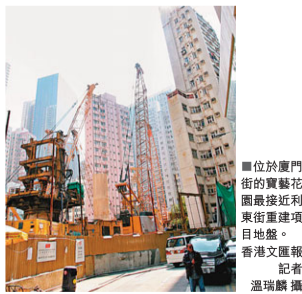
■位於廈門街的寶藝花園最接近利東街重建項目地盤。

而在廈門街開髮型屋的東主文先生表示,自去年10月地盤開始打樁後,其店內多處位置包括主力牆及廁所等,出現約6條裂痕,連招牌亦震鬆,有同事投訴感覺像地震。文先生又說:「我試過致電承建商,但被建議找地盤主管。我們只是小商戶,唯有逆來順受!」