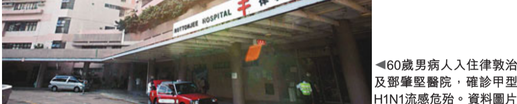
▲60歲男病人入住律敦治及鄧肇堅醫院,確診甲型H1N1流感危殆。