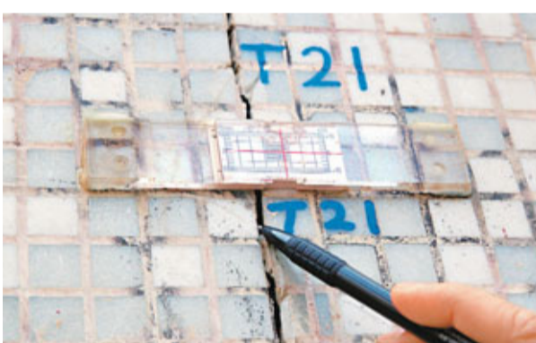
▲寶藝花園地下外牆的裂痕監察儀器顯示裂紋有移位近1厘米跡象。

寶藝花園內外都有裂痕,測量裝置亦顯示在過去幾個月,裂痕移位近1厘米。居民希望市建局信守承諾,一旦結構出現問題,協助住戶修葺。