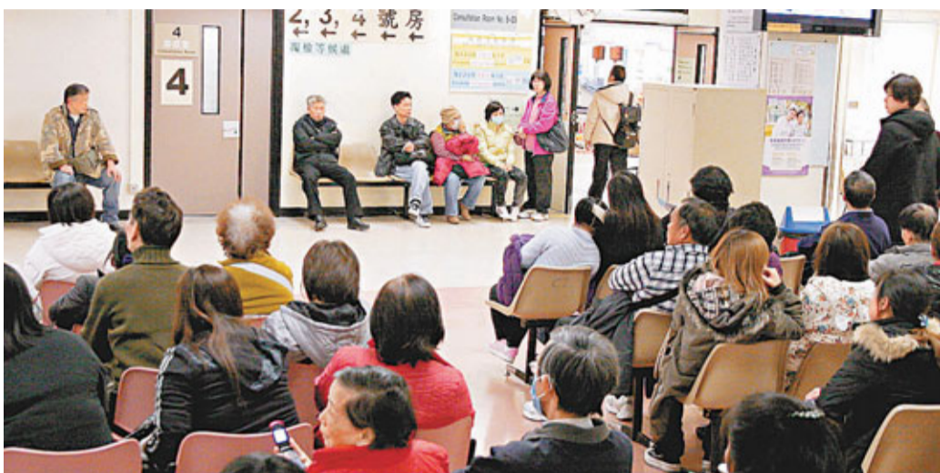
▲一連4日的農曆新年長假期間開始,公立醫院急症室及醫管局轄下12間普通科門診診所將會如常服務市民。

一連4日的農曆新年長假期間開始,公立醫院急症室及醫管局轄下12間普通科門診診所將會如常服務市民。醫管局表示,上月23至29日全港急症室求診人數,平均每日超過6,600人,較1月首個星期增加14%;往急症室求診者中,8%涉及呼吸道徵狀,亦較平日升近1倍。急症科部門主管劉楚釗預料,農曆新年期間尤其是大年初三及初四,到急症室求診人數會較平日增加30%至40%,非緊急類別的候診時間,料較現時平均等候2至3小時更長。醫管局將調動人手以作應付,又呼籲非緊急類別病人,在長假期可到門診或私家醫生求診。