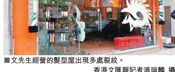
■文先生經營的髮型屋出現多處裂紋。