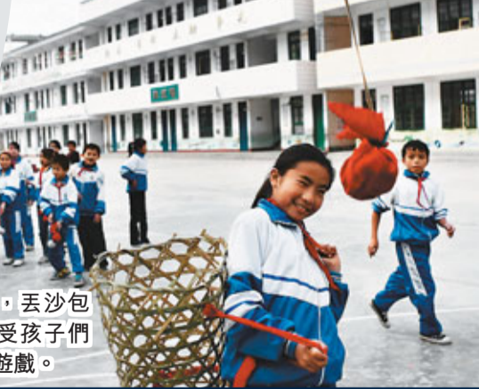
■課間，丟沙包成了最受孩子們歡迎的遊戲。