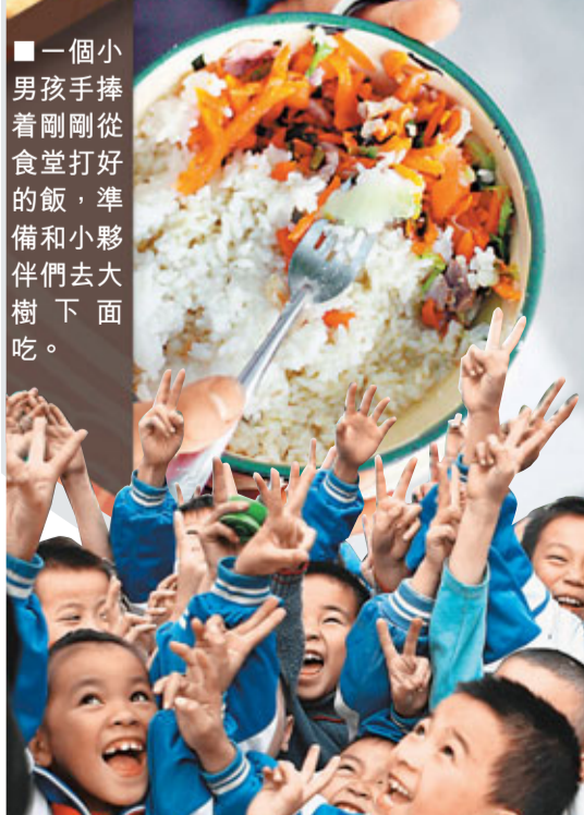
■一個小男孩子手捧着剛剛從食堂打好的飯，準備和小夥伴們去大樹下面吃。