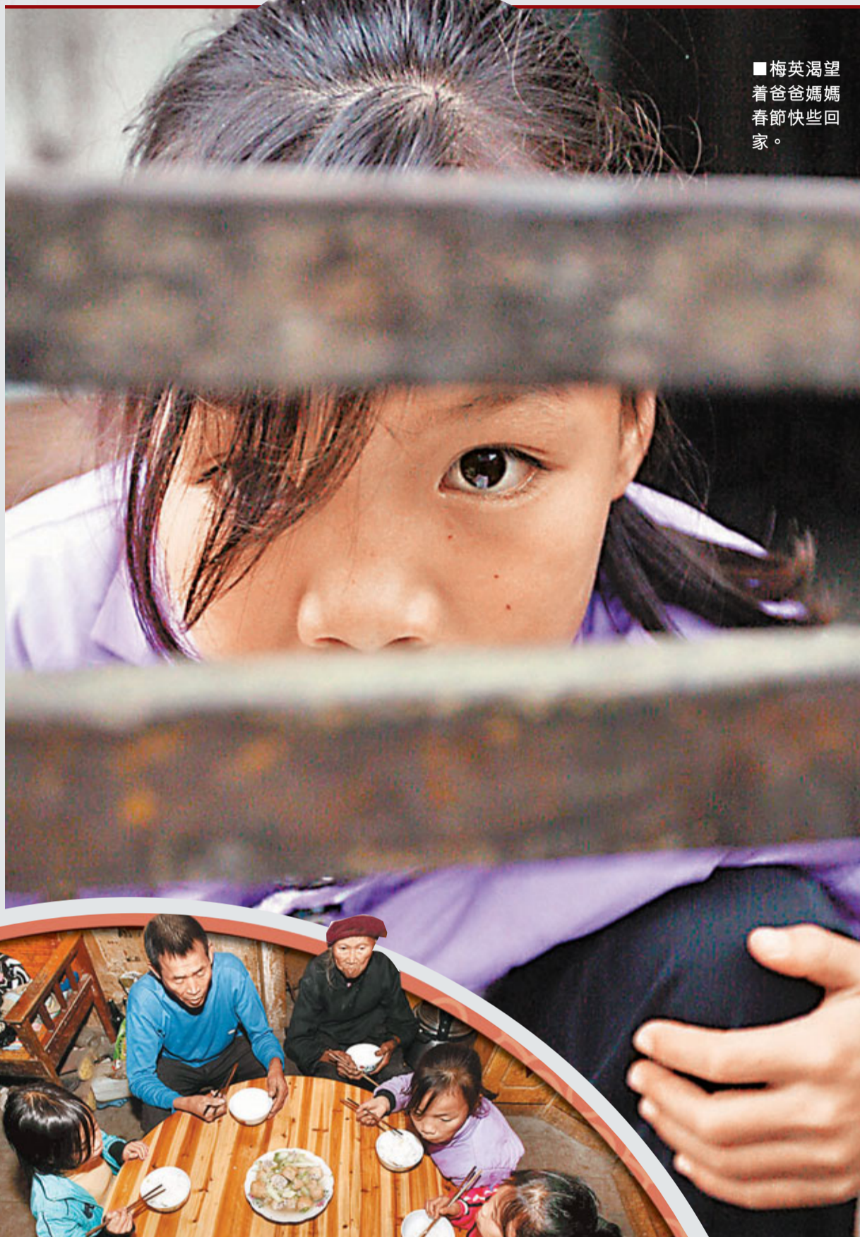
■梅英渴望着爸爸媽媽春節快些回家。