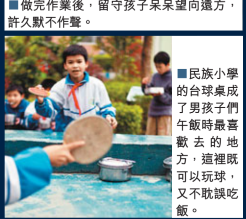
■民族小學的台球桌成了男孩子們午飯時最喜歡去的地方，這裡既可以打球，又不耽誤吃飯。