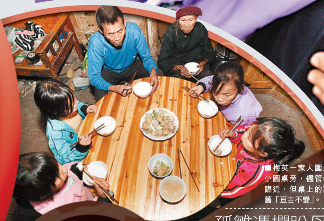
■梅英一家人圍坐在小圓桌旁，儘管春節臨近，但桌上的菜仍舊「亘古不變」。