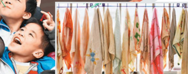
■天等縣民族小學學生宿舍，孩子們將毛巾整齊地掛在陽台上。