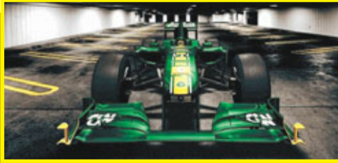
■F1蓮花車隊(Team Lotus)在其官網發佈了2011賽季F1新車T128，相比於去年的賽車，T128在設計上顯得更為激進，經過一年磨練的蓮花車隊希望在2011賽季中能獲得更多積分並在排名上擠進中游集團。

▼梅賽德斯GP車隊在其官方網站上公佈了一張其征戰2011賽季的新款F1賽車W02的圖片。車隊將在里卡多展開為期三天的測試工作。