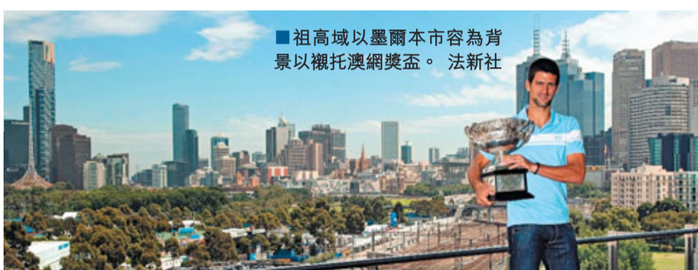
■祖高域以墨爾本市容為背景以襯托澳網獎盃。

在兩個月內連連贏下象徵團體最高榮譽的戴維斯盃和象徵個人頂尖成就的大滿貫獎盃——而且交出這樣一張「乾淨」的成績單，