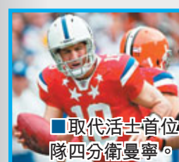
■取代活士首位的是小馬隊四分衛曼寧。