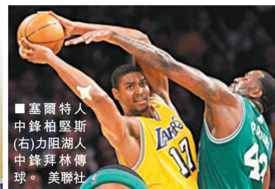
■塞爾特人中鋒柏堅斯(右)力阻湖人中鋒拜林傳球。