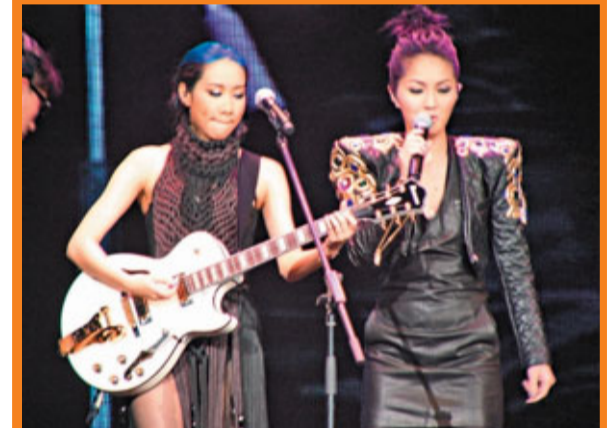
■楊千嬅要求Kary再彈結他一齊唱《熱血青年》。