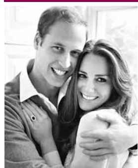
■威廉王子與女友凱蒂的訂婚照。

英國威廉王子與女友凱蒂將於4月29日舉行婚禮，英國報章揭露，數千名無政府主義者計劃在大婚前一個月，在婚禮地點西敏寺附近示威和搗亂，佔據軍營、警局和電視台等；到大婚當日，他們將混入嘉賓中乘機生事，更稱會出動煙霧彈和路障，攻擊王室成員專車，目的是逼使當局取消婚禮。