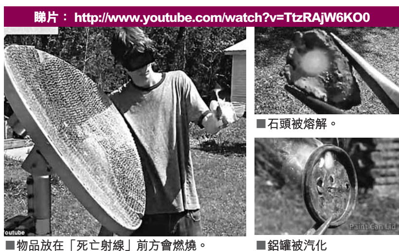
■物品放在「死亡射線」前方會燃燒。

美國一名少年發明出一種新的衛星天線，上面有5,800多面鏡子，能夠反射出相當於5,000顆太陽照射的溫度，不但能將石頭化成熔岩，甚至還可以讓鋼鐵汽化。少年將這個強力裝置命名為「死亡射線」，更打算製造威力更強、擁有3.2萬面鏡子的升級版。