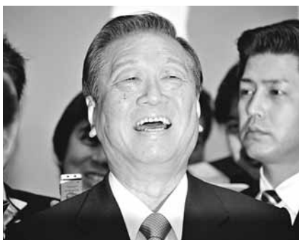
■小澤一郎受訪時一度大笑。

日本民主黨前黨代表小澤一郎，因資金管理團體收支報告作假案，被日本當局強制起訴，成為日本戰後司法史上第4宗案，也創下首位日本國會議員被強制起訴的先例，將對日本政壇帶來極大衝擊。據共同社報導，現年68歲的小澤一郎，在資金管理團體「陸山會」的購買土地收支報告中作假，東京地方法院指定檢察官昨日對小澤提出起訴，指其與3名前秘書合謀，違反《政治資金規正法》。