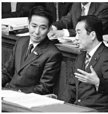
■前原誠司覬覦菅直人(右)的首相寶座。