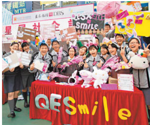
■6間獲星展贊助的中學攤位均出動龐大「促銷隊伍」，大打海戰術搶客，眾人落力叫賣。