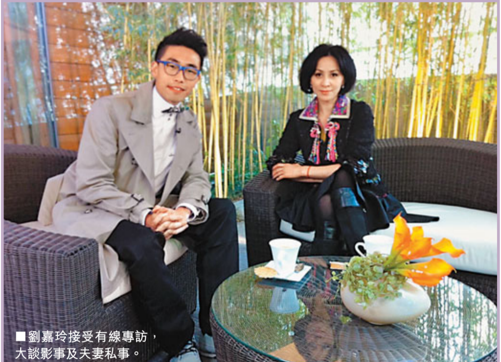
劉嘉玲接受有線專訪，大談影事及夫妻私事。

香港文匯報訊（記者 寧寧）劉嘉玲自2004年拍完《七年很癢》及《性感都市》後，已有多年沒有接拍港產片；但在2010年10月至今不過四個月，已有三部由劉嘉玲主演的電影在香港上畫，令她頻頻曝光。