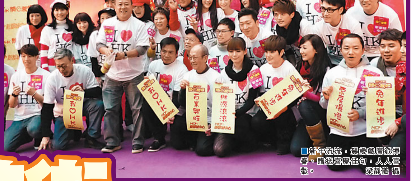
新年流流，賀歲戲廣派揮春、贈送喜慶佳句，人人喜歡。

香港文匯報訊（記者梁靜儀）曾志偉、吳君如、馮淬帆、呂慧儀、高海寧、楊秀惠、王祖藍及林欣彤等，昨日到將軍澳一個商場為賀歲片《我愛HK開心萬歲》造勢，身為監製及導演的曾志偉因唔識路而遲到一小時，要眾人苦等。