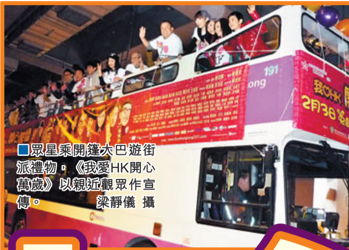
眾星乘開篷大巴遊街派禮物，《我愛HK開心萬歲》以親近觀眾作宣傳。

香港文匯報訊（記者梁靜儀）曾志偉、吳君如、馮淬帆、呂慧儀、高海寧、楊秀惠、王祖藍及林欣彤等，昨日到將軍澳一個商場為賀歲片《我愛HK開心萬歲》造勢，身為監製及導演的曾志偉因唔識路而遲到一小時，要眾人苦等。