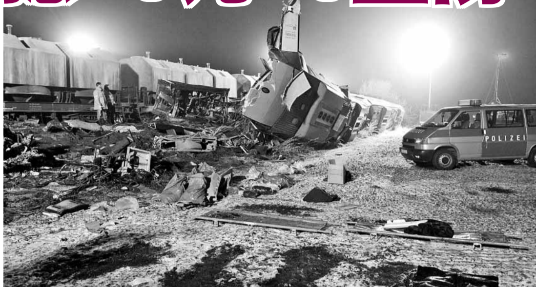
■ 出軌的客車嚴重損毀，碎片散落一地，並遺下擺放死者遺體的痕跡。

德國東部前晚發生客運與貨運火車迎頭相撞，當局在客運列車上發現8具屍體，事故並造成40多人受傷，當中20人重傷。法新社和美聯社則報道，事故造成10人死亡，並指警方和消防部門提供的死傷數字有出入。警方稱死亡人數料繼續上升。一名地區官員指，人為錯誤疑是肇事原因，可能有司機沒有遵守停車燈號。