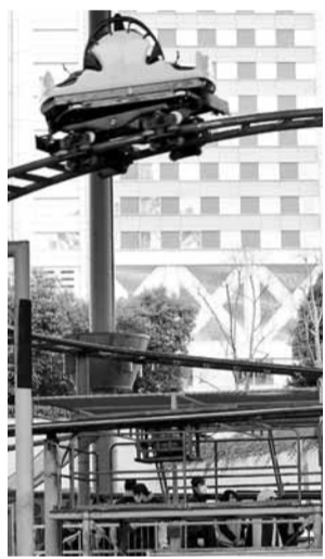
■ 警方調查出事的過山車。

日本東京「巨蛋城樂園」昨日發生罕見意外，一名34歲男子搭乘高速過山車時，在離地8米的一個彎道突然飛離座椅墜地，送院後不治。當局正調查事故原因，遊樂場已暫時關閉。