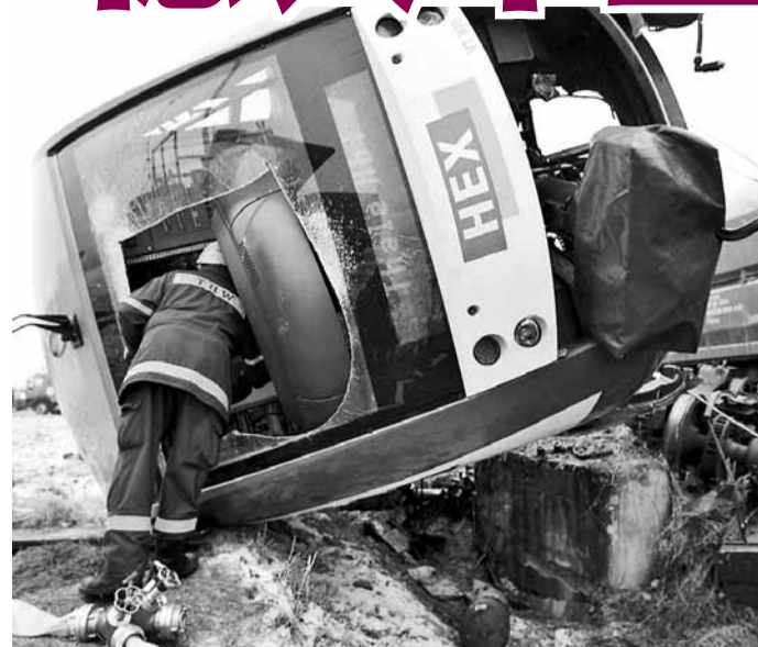
■ 救援人員搜尋生還者。