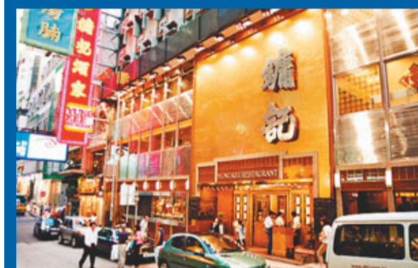
▶南豐集團創辦人陳廷驊家族去年爆出不和糾紛。