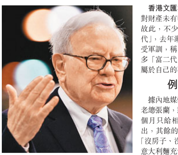
■「股神」巴菲特一直穩坐全球首富三甲位置,但其長子霍華德卻對繼承父業不感興趣。

另外,家族的影響力對於商業王國的延續性,亦具有極其重要的作用。IBM和摩托羅拉的CEO都將職位傳給兒子,就被市場視為「可持續發展」的保證。