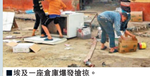
■埃及一座倉庫爆發搶掠。

從電視畫面看，博物館內一片狼藉，珍貴文物被扔到地上，展櫃玻璃被砸爛，目前軍隊已經進入博物館持槍巡邏，保護文物。