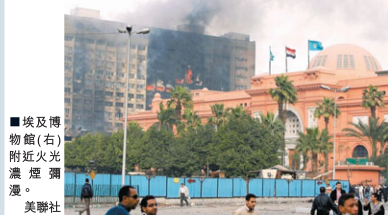
■埃及博物館(右)附近火光濃煙瀰漫。

埃及示威浪潮持續，收藏珍貴文物的博物館也遭暴徒搶掠。位於開羅塔里爾廣場的埃及博物館，暴徒扯去兩具木乃伊的頭部，並破壞約10件人工製品後打算逃走，但被軍人拘捕。在國家博物館，珍貴文物被扔到地上，展櫃玻璃被砸爛，9個身份不明者被捕。