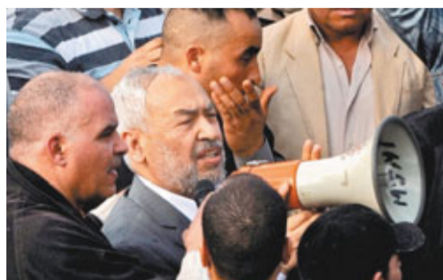
■拉希德·加努希(中)甫抵達突尼斯機場，即持大聲公向支持者講話。

突尼斯伊斯蘭領袖拉希德·加努希在流亡海外20多年後，昨日由英國乘坐飛機回國。69歲的他在登機前表示感到十分高興，並透露由他領導的「復興運動」將正式註冊為政黨，計劃參加該國首次民主選舉。