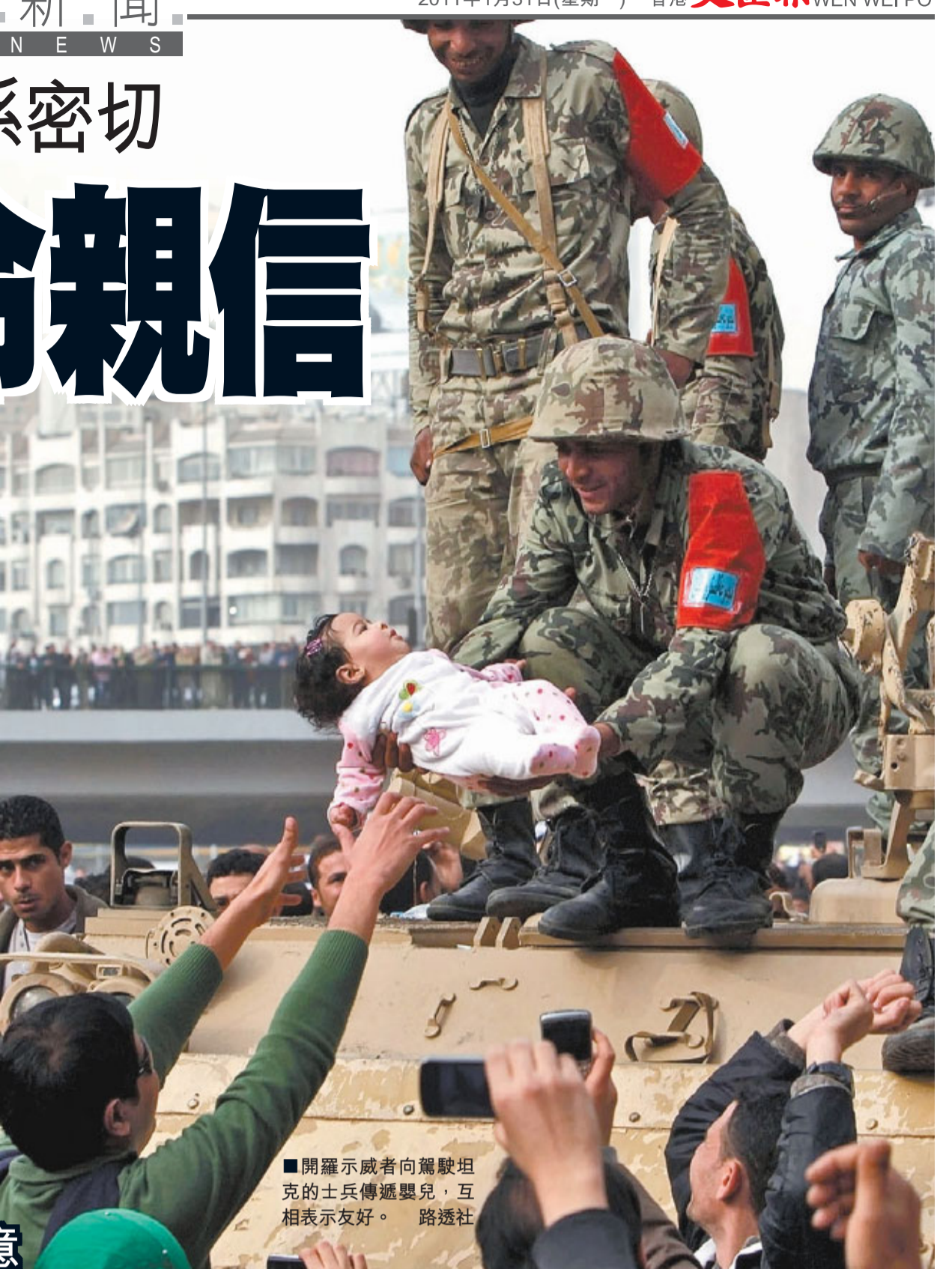
■開羅示威者向駕駛坦克的士兵傳遞嬰兒，互相表示友好。路透社

第一夫人蘇珊是埃及和威爾斯混血兒，持有英國護照，活躍於上流社會，經常出席慈善和外交活動。據報她每年捐出數百萬英鎊行善，不過據稱部分款項暗地裡流進自己的銀行帳戶，有人更批評她是埃及版的「法國末代王后瑪麗·安托瓦妮」，生活奢華，不知民間疾苦。■《星期日郵報》/《星期日人物報》