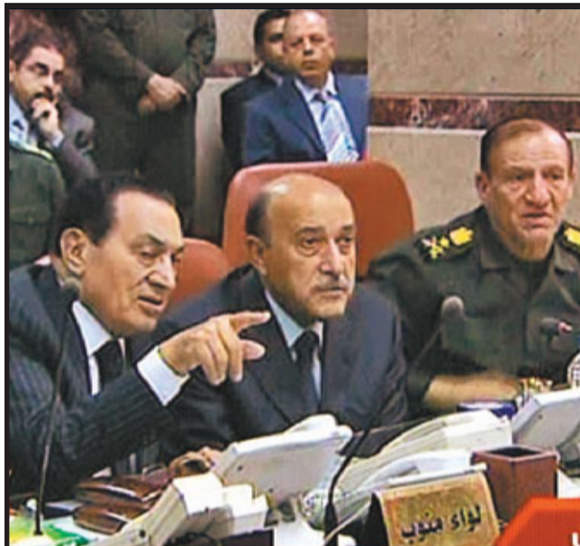
■穆巴拉克(左)與蘇萊曼(中)等召開會議。

1987年本·阿里發動流血政變，2年後拉希德·加努希先後流亡到阿爾及利亞和英國，他因被指圖謀推翻本·阿里而被判囚終身。