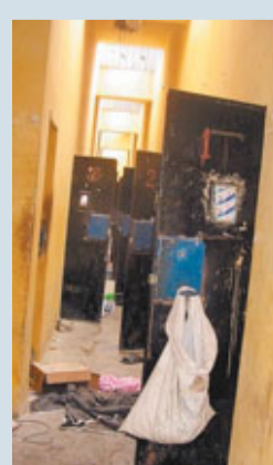
■監獄囚犯全跑光，房門大開。