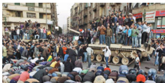
■開羅部分示威者爬到坦克上，亦有大批示威者向坦克下跪祈禱。