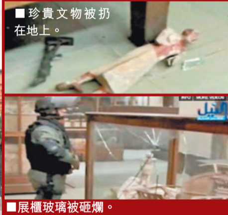
■珍貴文物被扔在地上。

出乎意料的是，向來以「警察都市」見稱的開羅和其他大城市，警察突然消失得無影無蹤，他們早前守衛的銀行、道路交匯處和重要建築物變成「零保安」。民眾指政