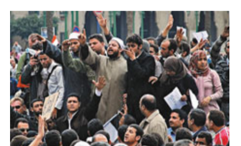
■開羅的穆斯林教士參與示威。