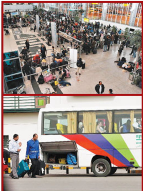
開羅國際機場塞滿欲離開「戰地」的旅客。