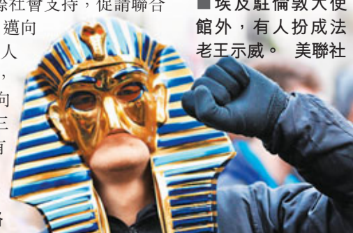
埃及富商乘私人機逃往迪拜

機場職員透露,沙特阿拉伯、黎巴嫩、阿聯酋和約旦前日增派10班機,從開羅撤走官員和外交人員家屬。土耳其昨日已派出兩架專機撤僑。機場官員透露,前日有19架私人飛機接載埃及和阿拉伯富商的家屬離開,大多飛往迪拜。據報從昨日起,軍方已進駐保護機場。 ■美聯社/路透社/中央社/《星期日鏡報》