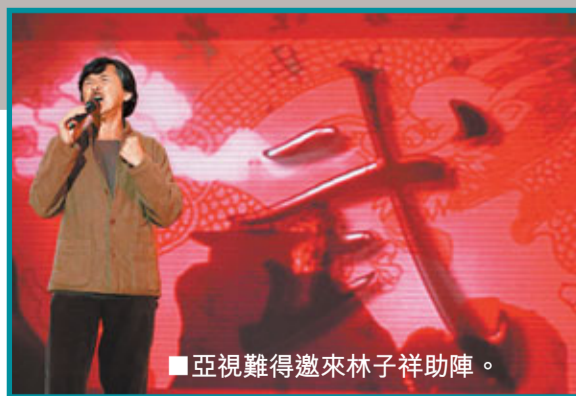
亞視難得邀來林子祥助陣。

「廣州版周星馳」溫超在春節晚會上除了演繹賀年劇，又客串做司機，在賀年劇中他會扮演《讓子彈飛》的姜文。首次與亞視合作的溫超，被問到會否擔心被無綫阻止宣傳？他坦言自己為實現理想，不會刻意分辨任何平台宣傳，同時又透露正忙於參與一部香港電影的拍攝。