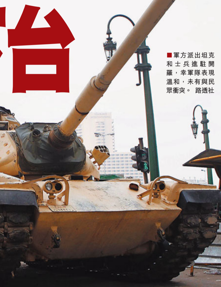
■軍方派出坦克和士兵進駐開羅,幸軍隊表現溫和,未有與民眾衝突。