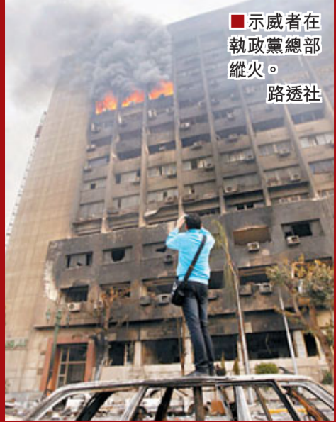
■示威者在執政黨總部縱火。