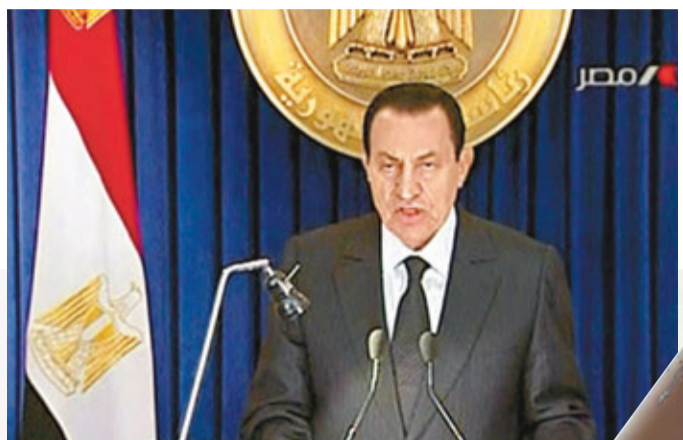
■穆巴拉克連日來終首次露面,但拒絕辭職。