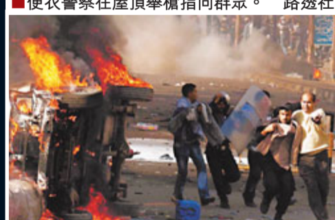
■警方和示威者一同避開着火汽車。

美國視埃及為重要盟友,每年向埃及提供15億美元(約117億港元)援助,包括13億美元(約101億港元)軍事援助。但白宮發言人吉布斯昨日警告,埃及如果暴力鎮壓反政府示威,美國將重新檢討對埃及的援助。