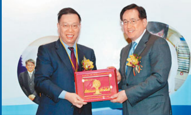
黃潔夫和周一嶽於開幕儀式上交換紀念品。

香港文匯報訊(記者 鄭治祖) 第9屆內地、香港、澳門衛生行政高層聯席會議昨日舉行。香港食物及衛生局局長周一嶽透露，三方在會上討論過流感肆虐的問題，並會密切監察，在有需要時三地會溝通，共同研究病毒等。